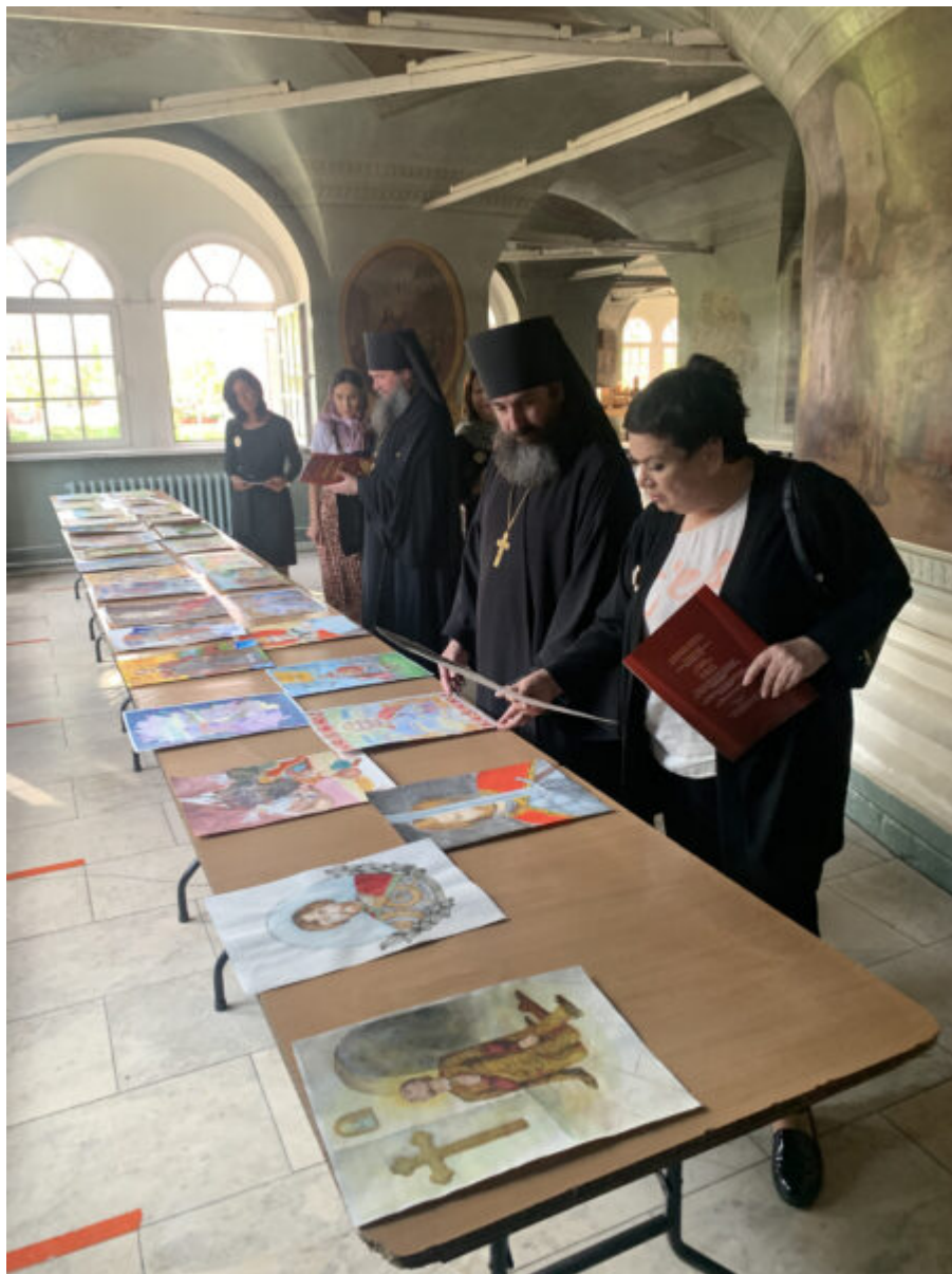
Патриархия.ru & pravobraz.ru