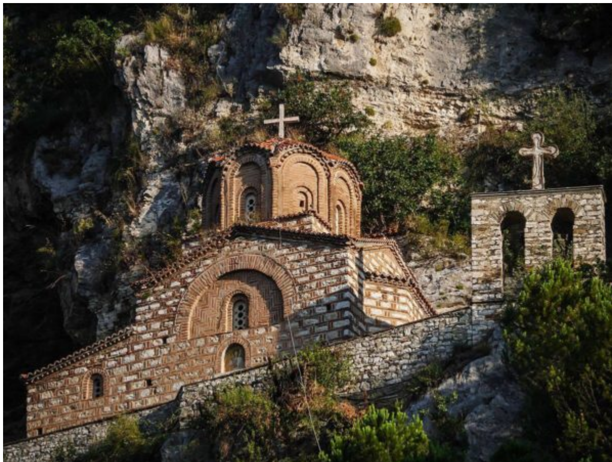
Kisha Orthodhokse Autoqefale e Shqipërisë