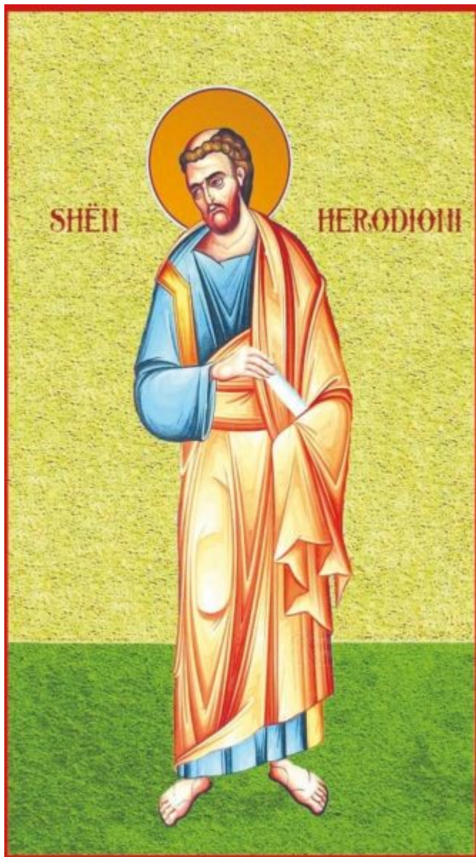
Kisha Orthodoxke Autoqefale e Shqipërisë