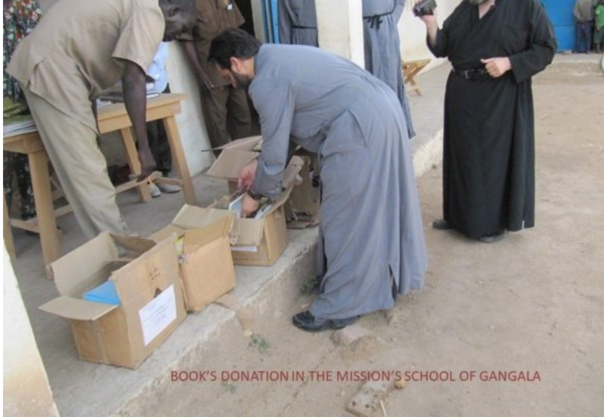
BOOK'S DONATION IN THE MISSION'S SCHOOL OF GANGALA