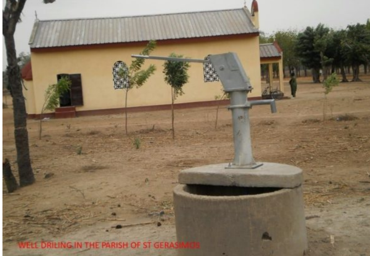
WELL DRILING IN THE PARISH OF ST GERASIMOS