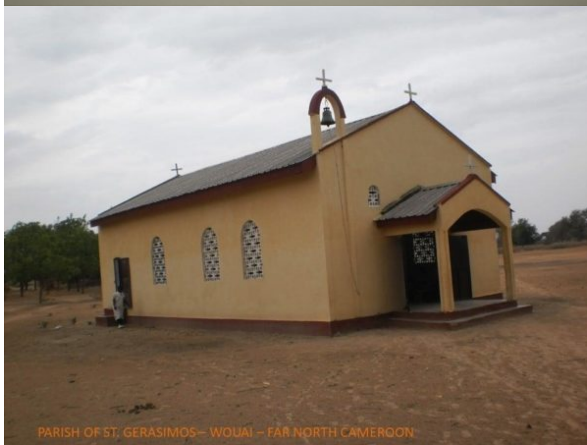
PARISH OF ST. GERASIMOS – WOUAI – FAR NORTH CAMEROON