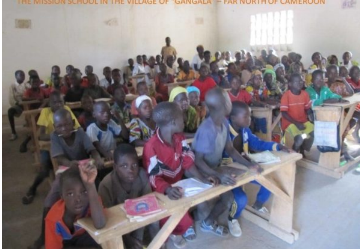
THE MISSION SCHOOL IN THE VILLAGE OF "GANGALA" – FAR NORTH OF CAMEROON