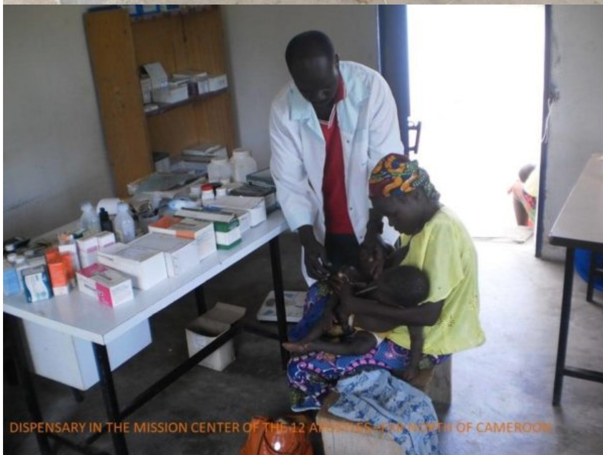
DISPENSARY IN THE MISSION CENTER OF THE 12 APOSTLES - 11 KM NORTH OF CAMEROON