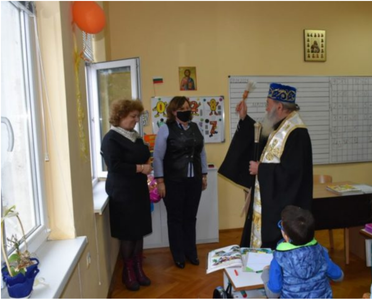
на Ловеч " поради