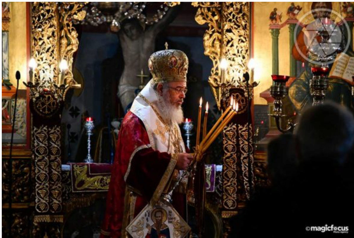
Η προσκύνηση της Ιεράς εικόνας του Αγίου, καθώς και απομμήματος του Αγίου, έγινε στον ναό του Αγίου Νικολάου. Οι πιστοί