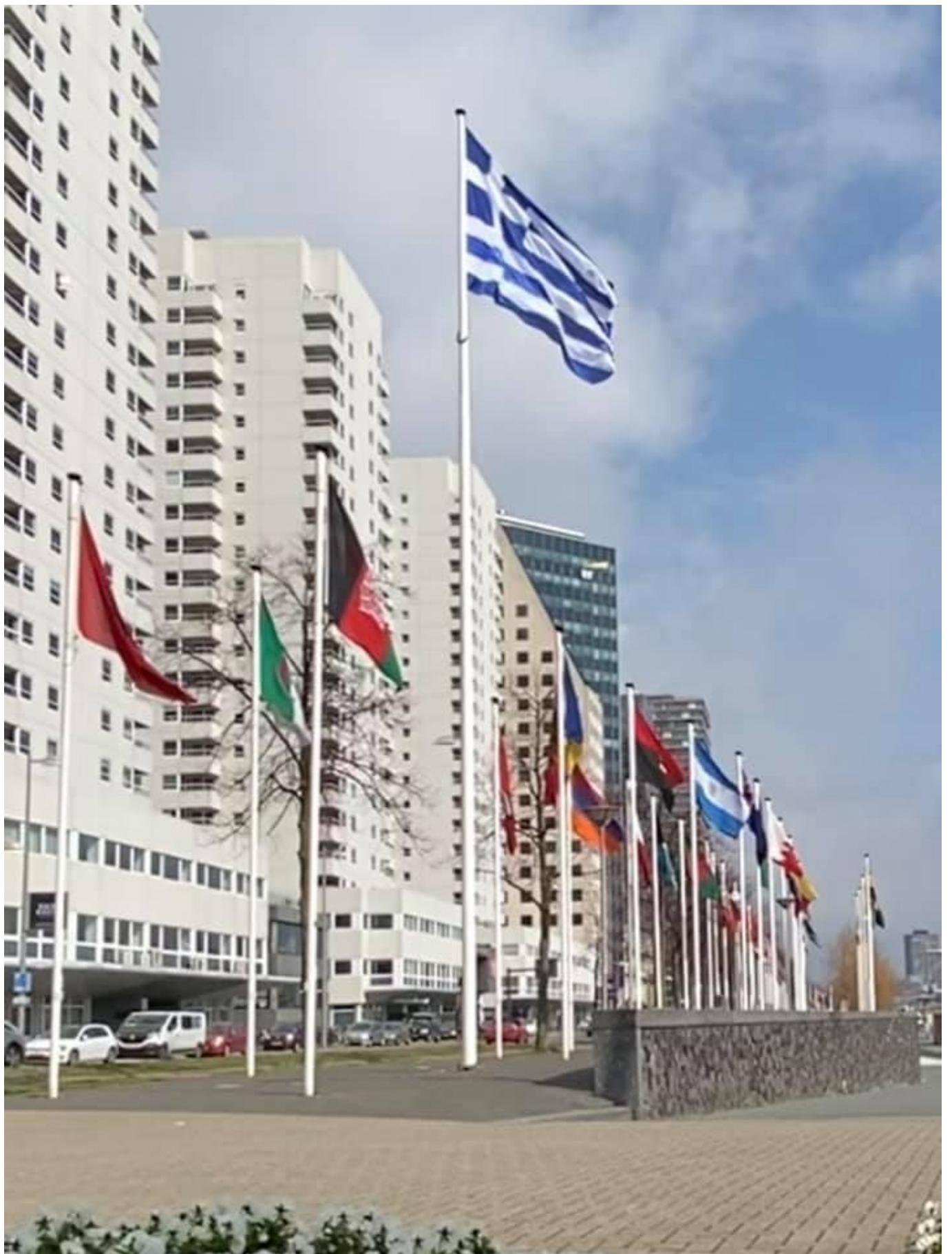
Η ελληνική σημαία προβάλλεται στον περιστρεφόμενο θόλο του Al Hazm Mall στη