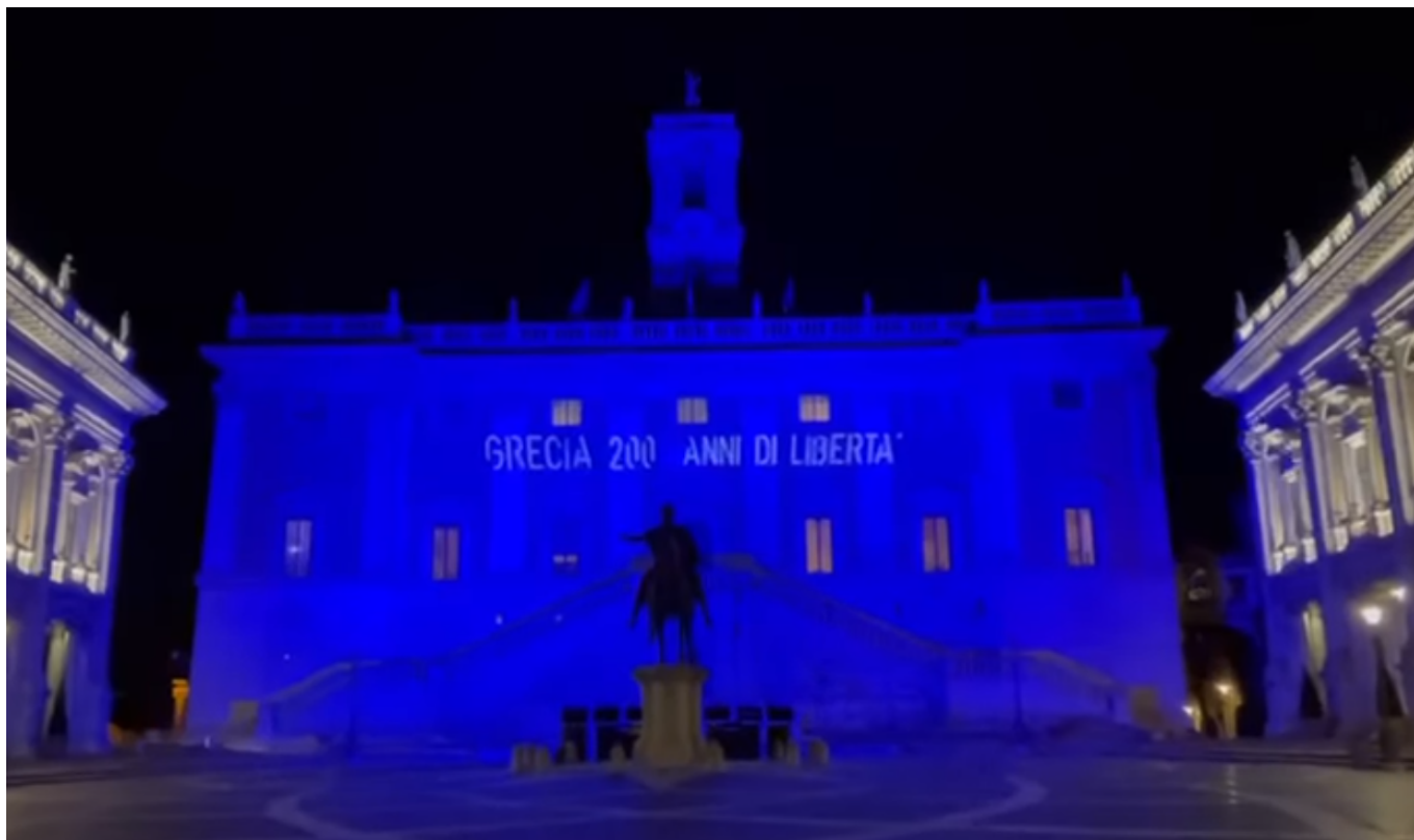
Φωτογραφίες από το Greek Ministry of Foreign Affairs | Η Ελλάδα στον Κόσμο