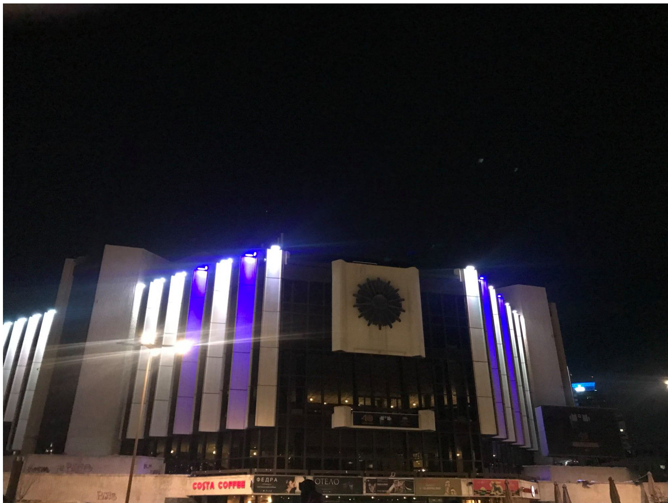
Τα Προπύλαια στο Μόναχο φωτισμένα στα γαλανόλευκα για τους εορτασμούς των 200 ετών από την Επανάσταση του 1821