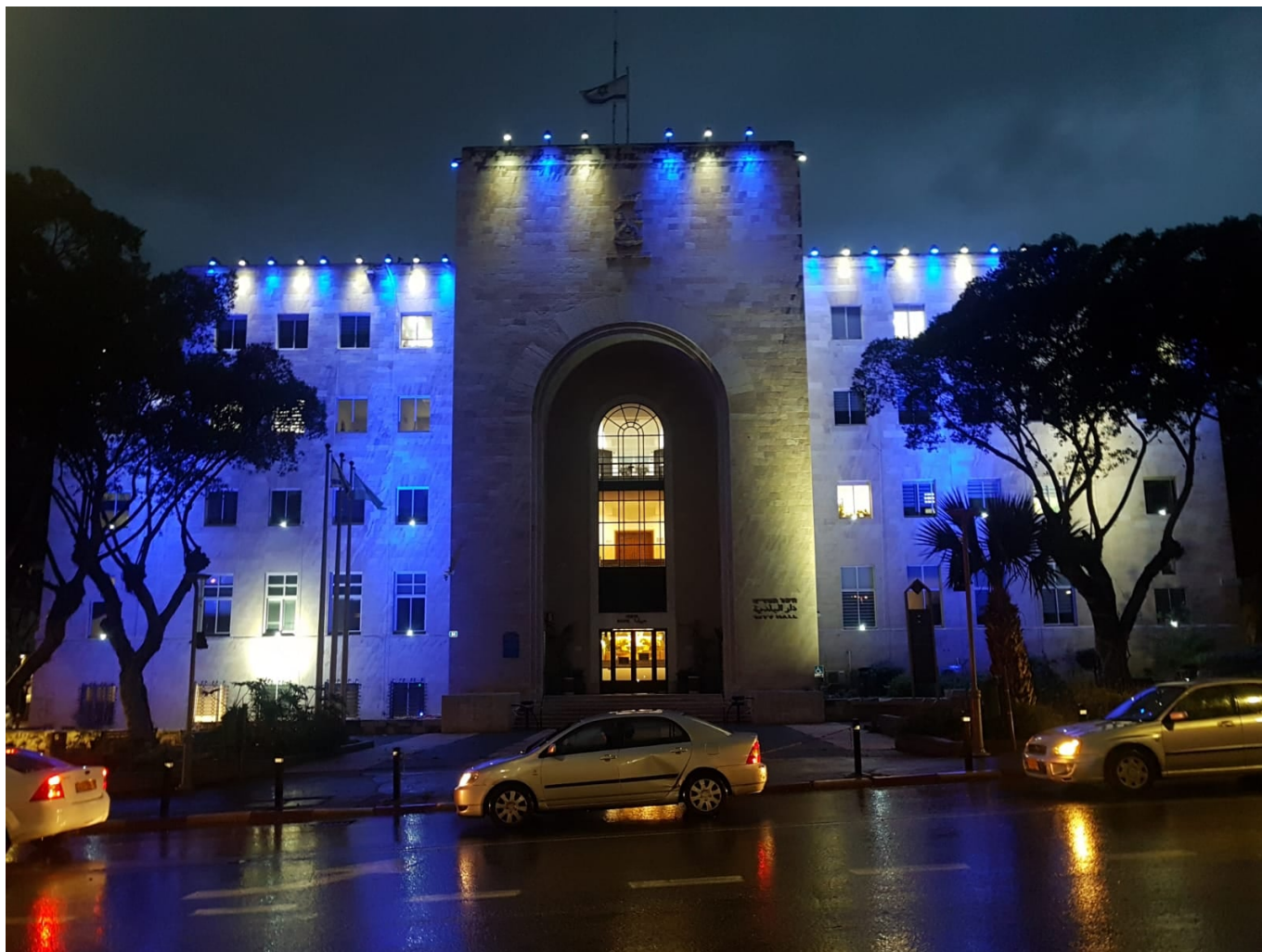
Το Καπιτώλιο της Ρώμης φωτίστηκε με τα χρώματα της ελληνικής σημαίας προς τιμή της επετείου των 200 ετών από την Επανάσταση του 1821