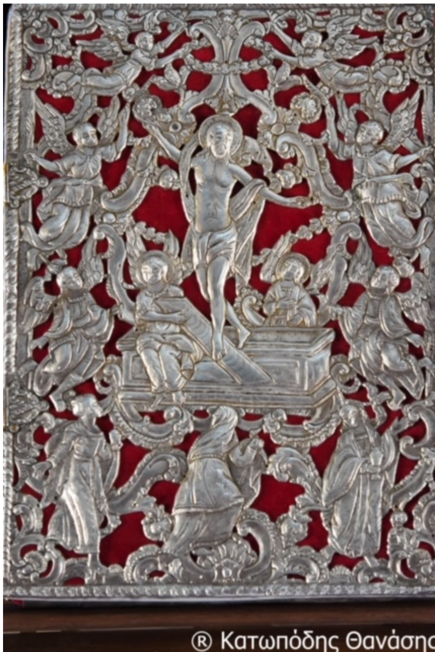
® Κατωπόδης Θανάσης