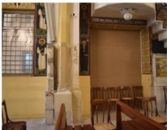
Openings rehabilitation - before