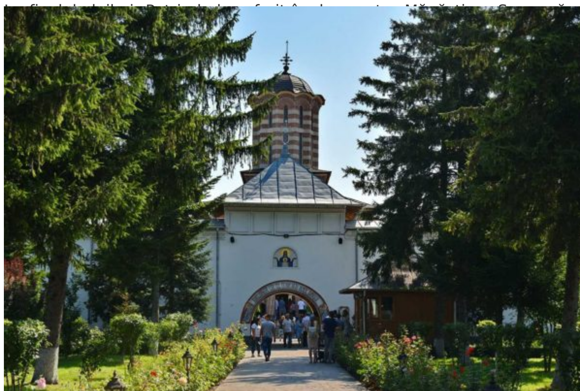
Ști tămâie Patriarhiei

„De aceea, e bine ca în fiecare zi să citim un fragment, un pasaj din Sfânta Scriptură, un cuvânt de învățătură al Sfinților Părinți care erau purtători de Duh Sfânt și luminători de suflete. Și, așa, noi hrănim sufletul nostru și îl îmbrăcăm cu lumină. Și, astfel, căutăm împărăția lui Dumnezeu și o dobândim în arvună, în anticipație, urmând ca după învierea din morți să primim plinătatea împărăției cerurilor, când sufletul și trupul împreună își refac unitatea lor și participă la slava și iubirea Preasfintei Treimi”.