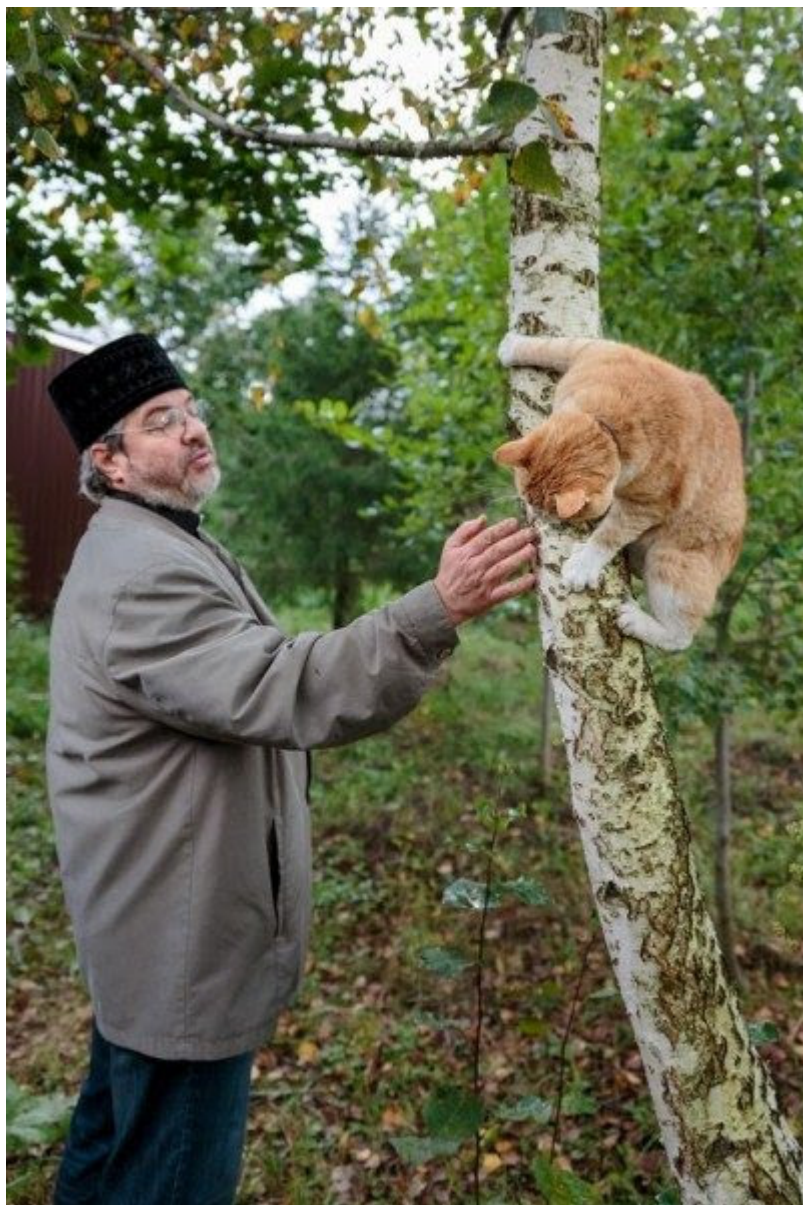
Приют для животных в храме Илии Пророка в деревне Лемешево

В Оптиной пустыни кошки еще и в крестном ходе принимают участие . К сожалению, в монастырь каждый год подкидывают много котят и взрослых кошек и волонтерам приходится постоянно пристраивать их.