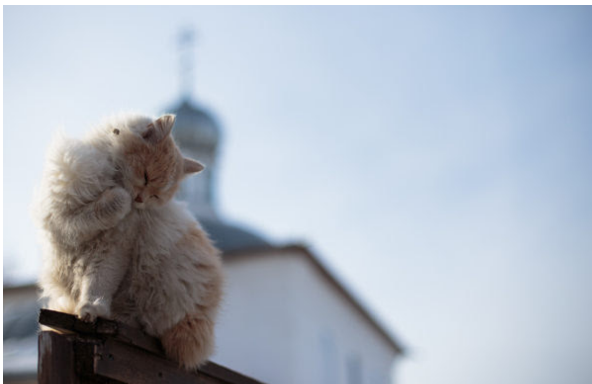
Введенско-Жабынский монастырь