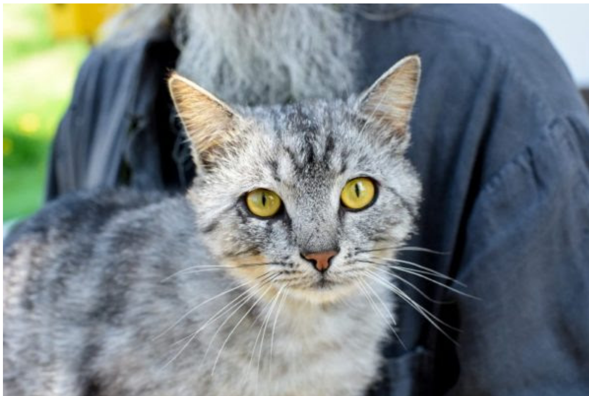
Подопечный кошачьего приюта Нещеровский Спасо-Преображенский монастырь

Свой кошачий приют есть и в храме Илии Пророка в деревне Лемешево. Животных кормят, делают им прививки, стерилизуют и пристраивают в семью.