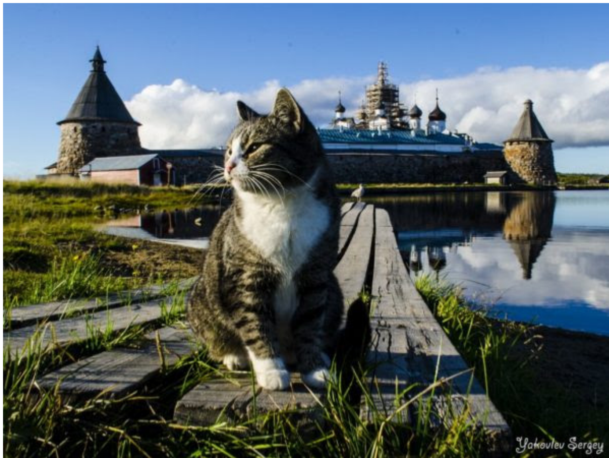
Соловецкий монастырь.