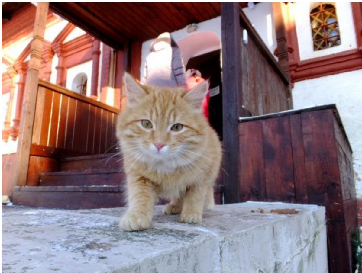
Саввино-Сторожевский монастырь, Звенигород https://ponaehala-ya.livejournal.com/profile