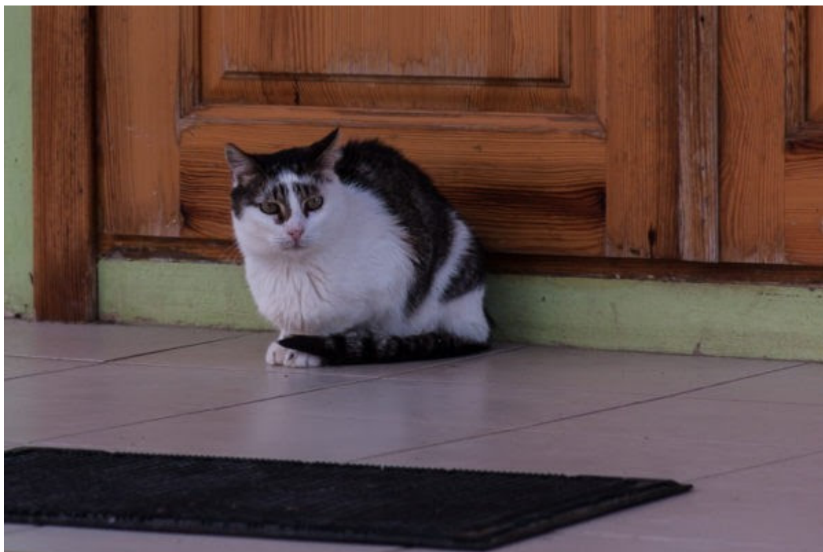
Топловский женский монастырь