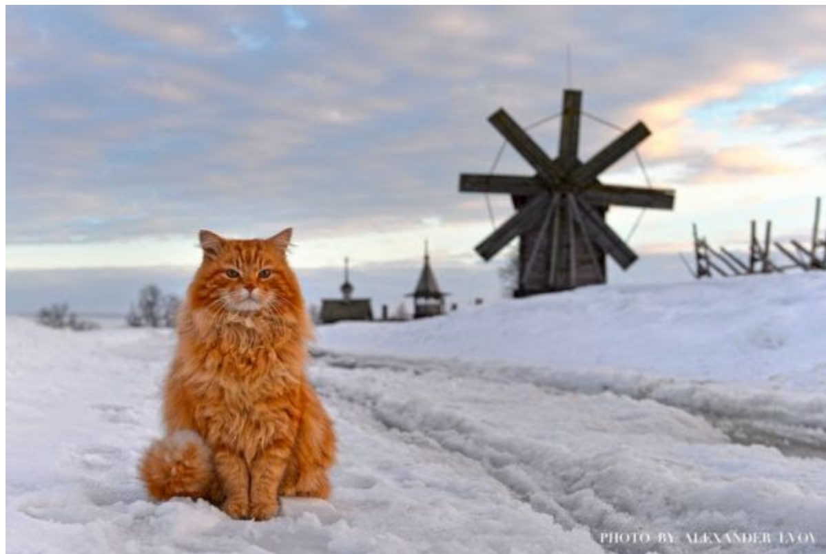
Кот Кеша и Киж

Зоозащитники забеспокоились и даже стали передавать на остров пакеты с питанием. В итоге кота приютили в музее и он с удовольствием позирует гостям Кижей.