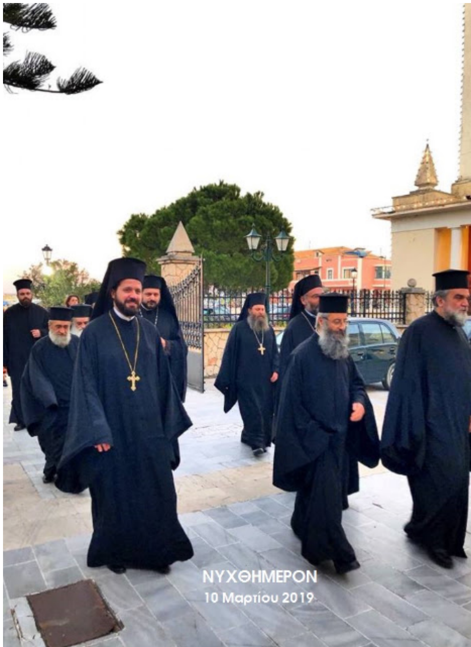
ΝΥΧΘΗΜΕΡΟΝ 10 Μαρτίου 2019