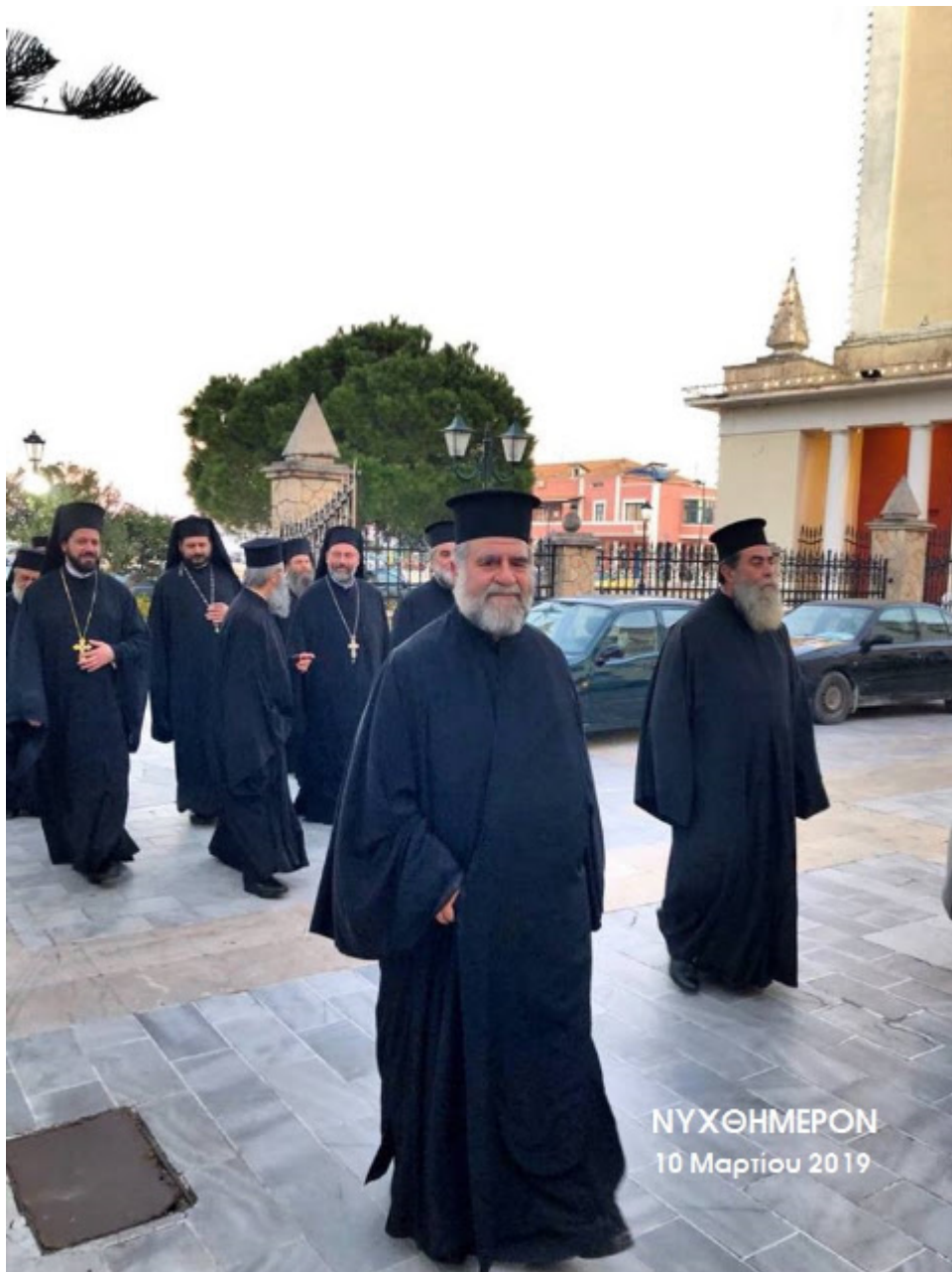
ΝΥΧΘΗΜΕΡΟΝ 10 Μαρτίου 2019