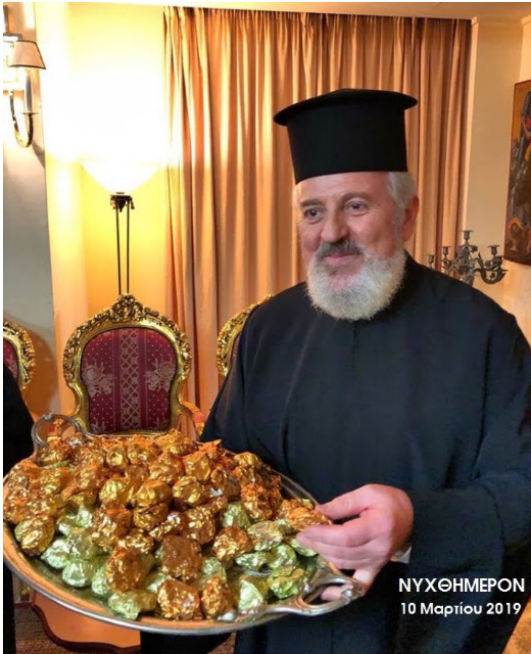
ΝΥΧΘΗΜΕΡΟΝ 10 Μαρτίου 2019