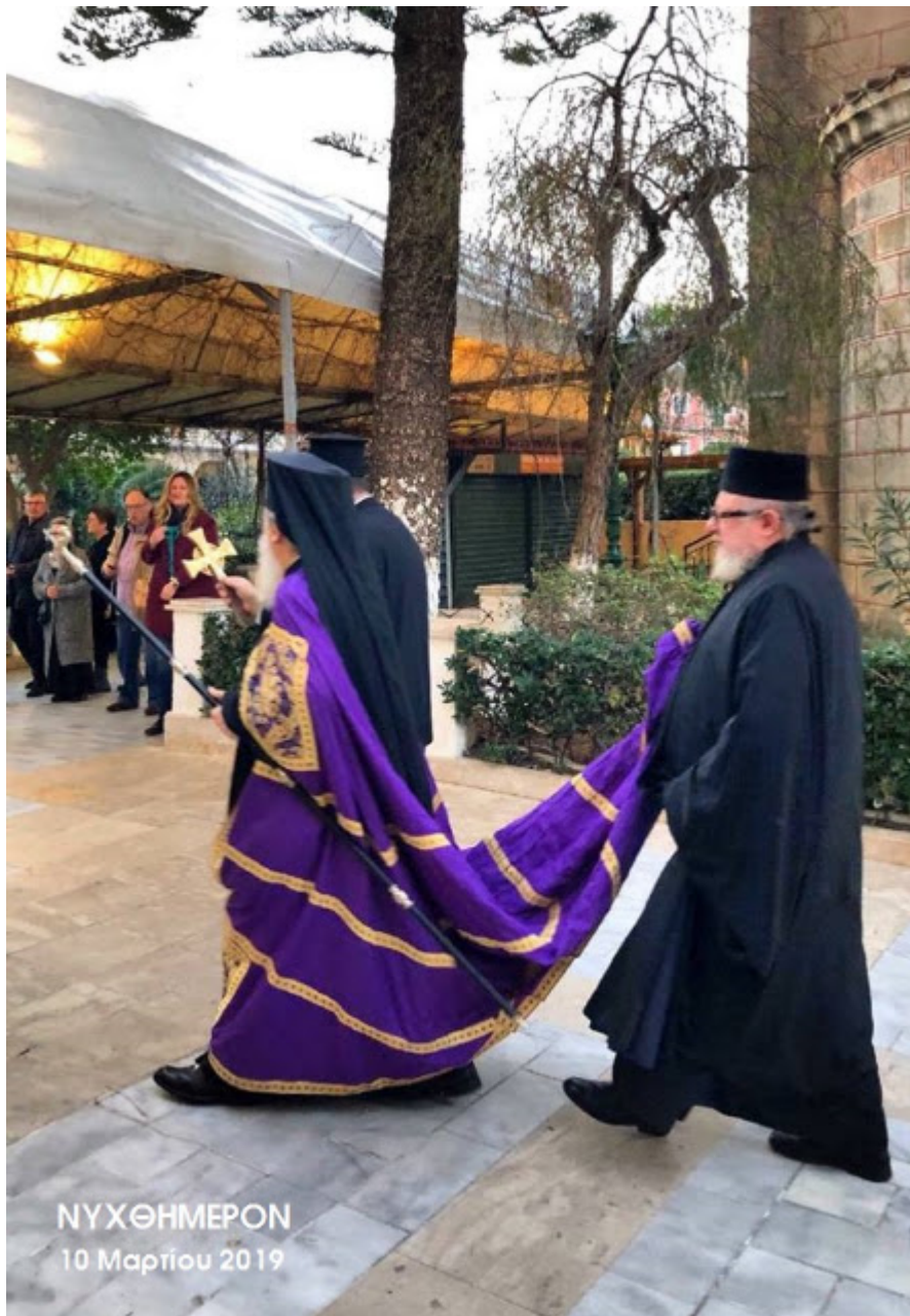
ΝΥΧΘΗΜΕΡΟΝ 10 Μαρτίου 2019