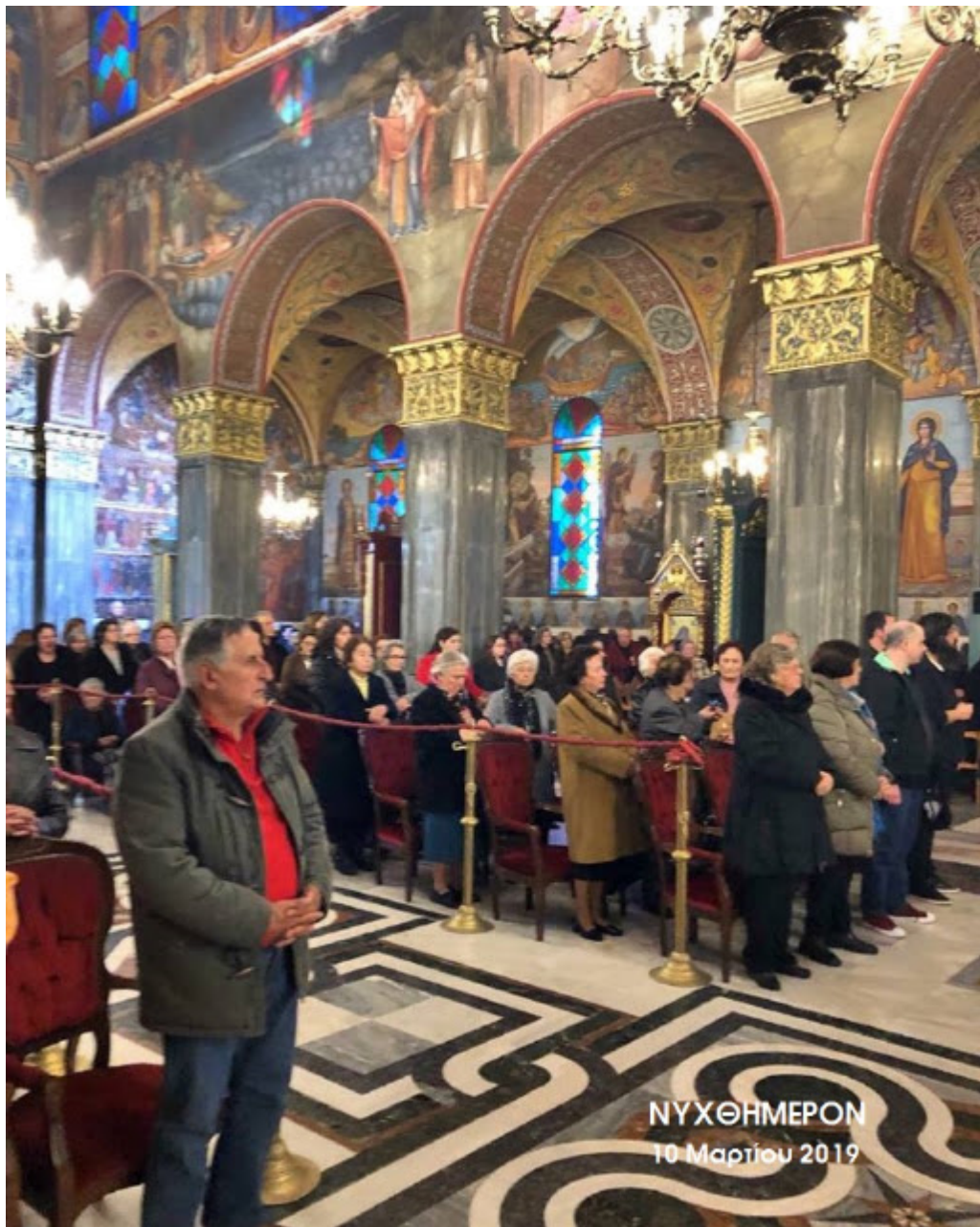
ΝΥΧΘΗΜΕΡΟΝ 10 Μαρτίου 2019