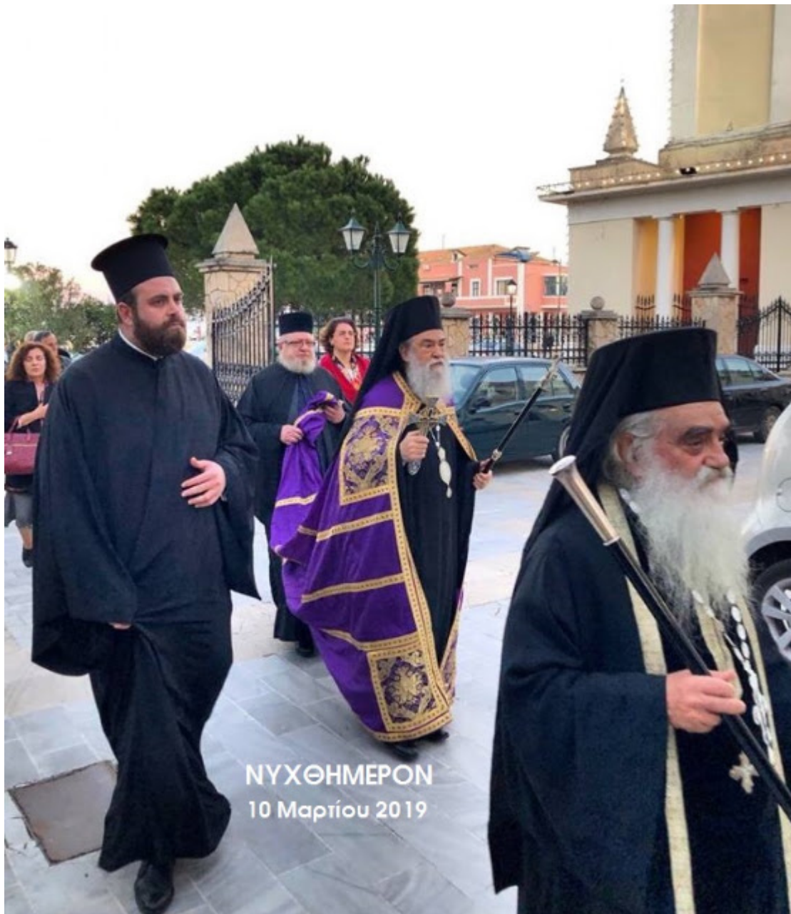
ΝΥΧΘΗΜΕΡΟΝ 10 Μαρτίου 2019