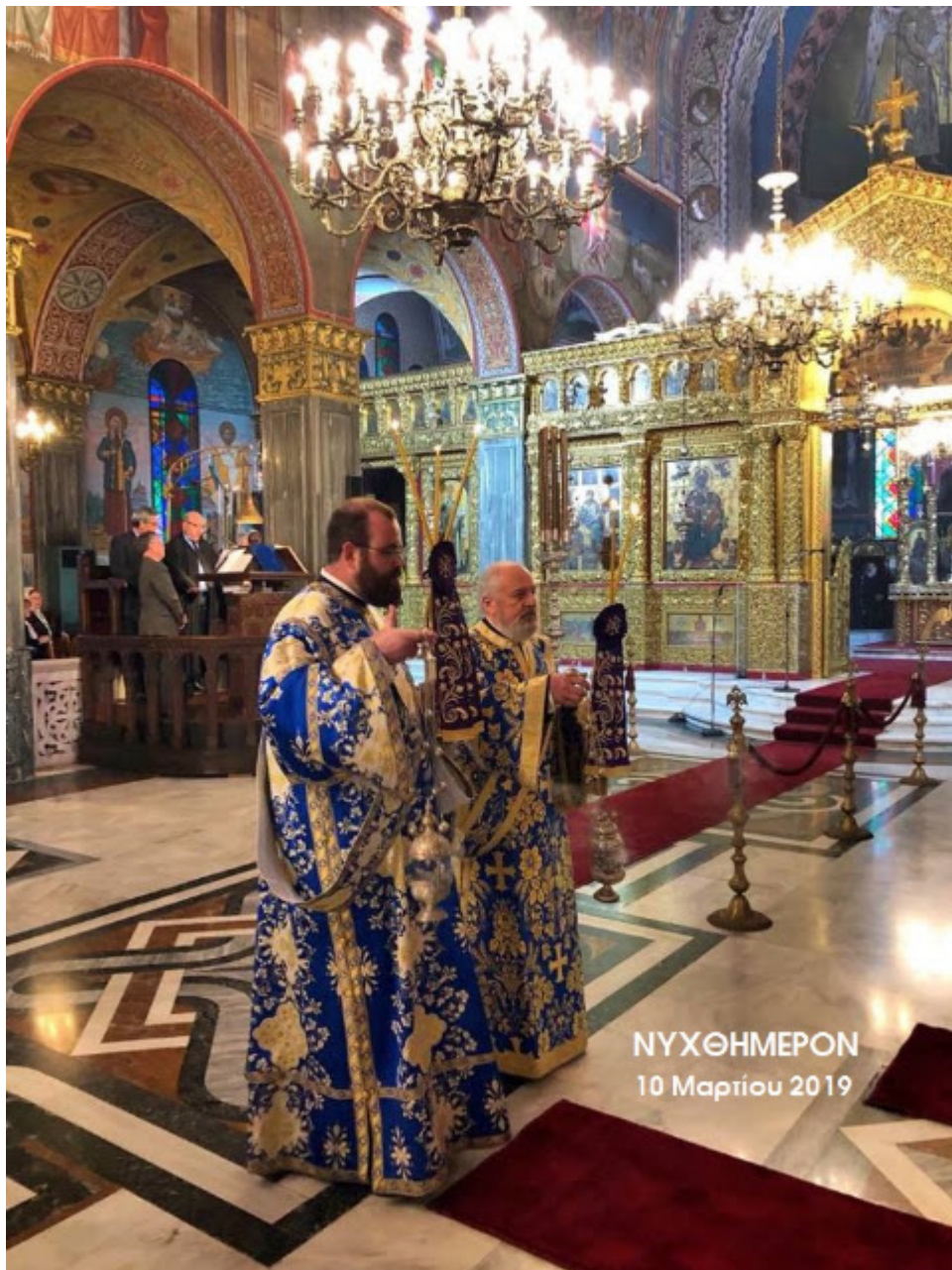
ΝΥΧΘΗΜΕΡΟΝ 10 Μαρτίου 2019