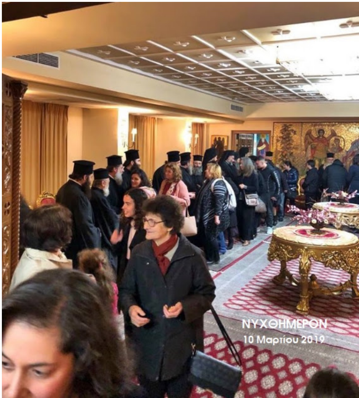
ΝΥΧΘΗΜΕΡΟΝ 10 Μαρτίου 2019