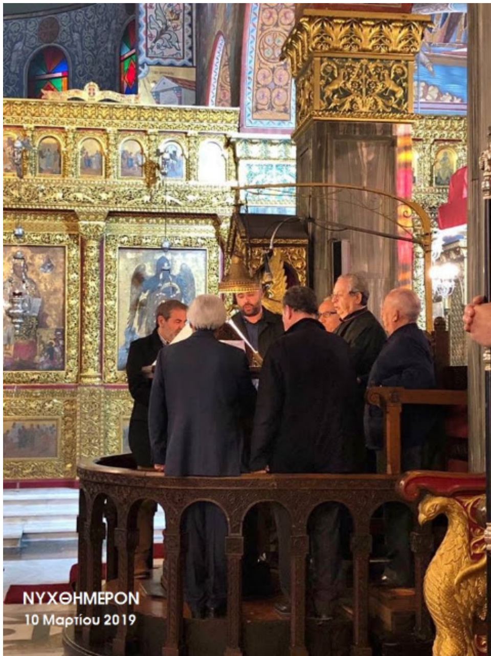
ΝΥΧΘΗΜΕΡΟΝ 10 Μαρτίου 2019