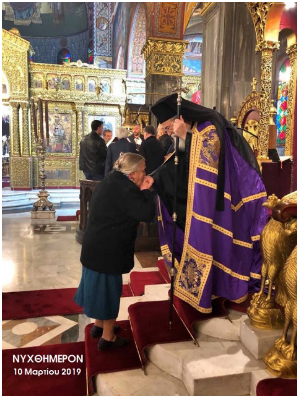
ΝΥΧΘΗΜΕΡΟΝ 10 Μαρτίου 2019