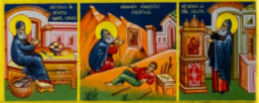
Icona de Sfântul Antipa de Garmesti Muzeul Național de Artă Romenă București