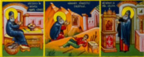
Icona di Sant'Antipa di Garmesti MUSEO DI GARMESTI CANTONE DI GARMESTI CANTONE DI GARMESTI