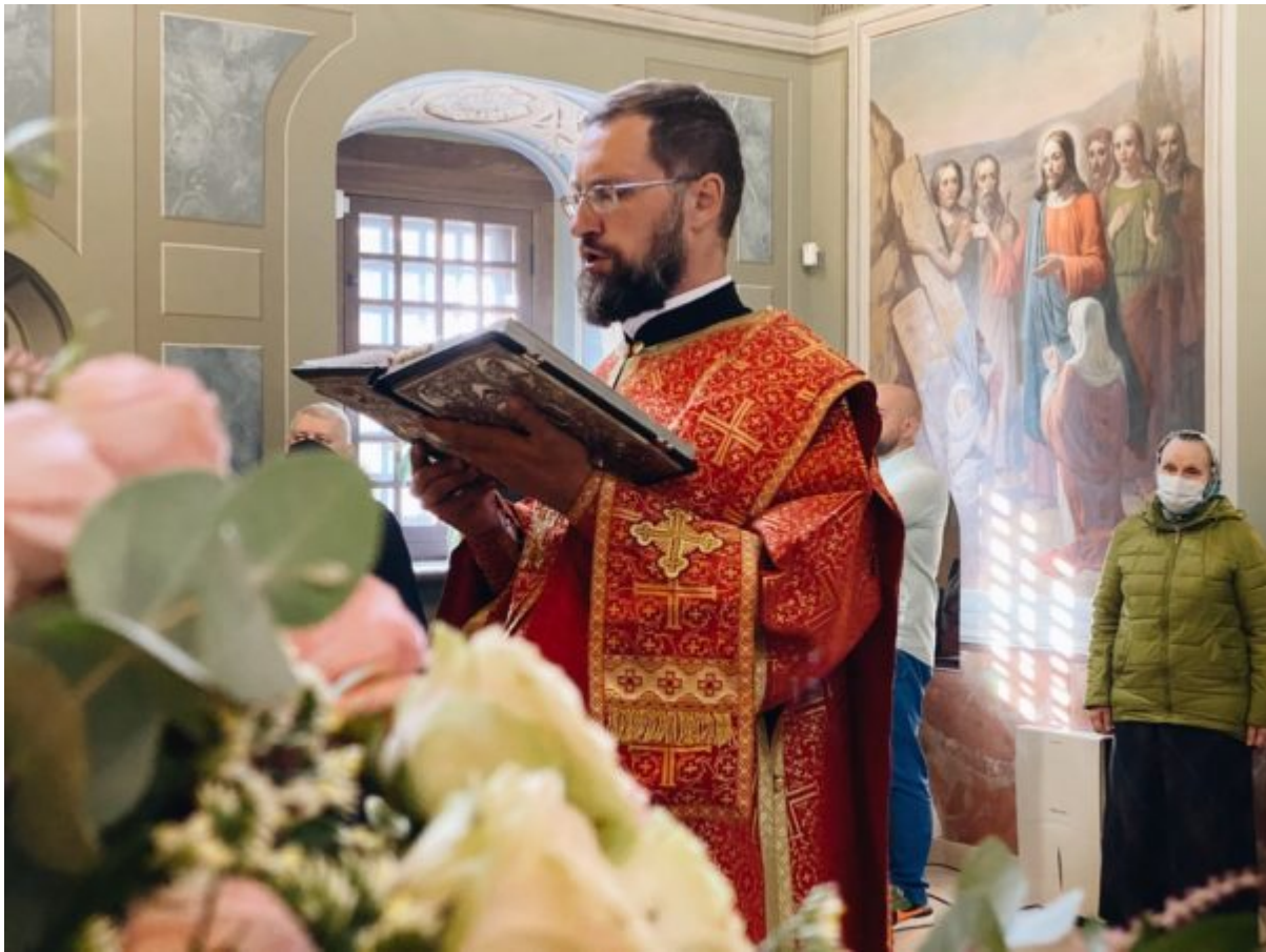
Processed with VSCO with a6 preset