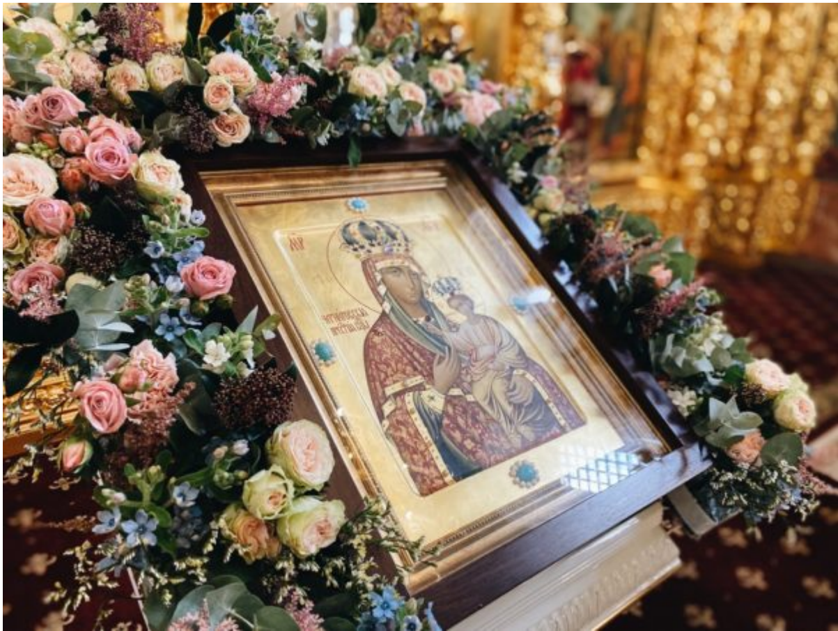
Processed with VSCO with a6 preset