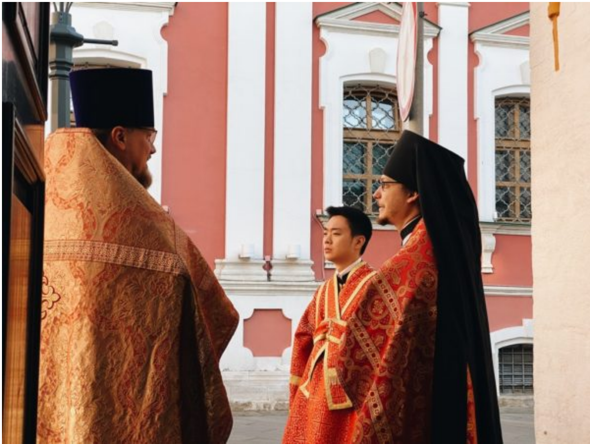
Processed with VSCO with a6 preset