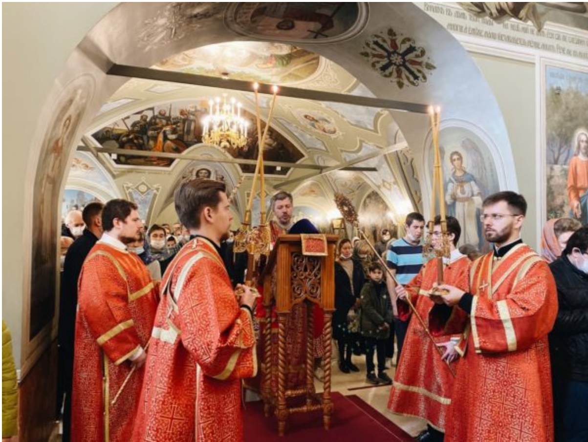
Processed with VSCO with a6 preset