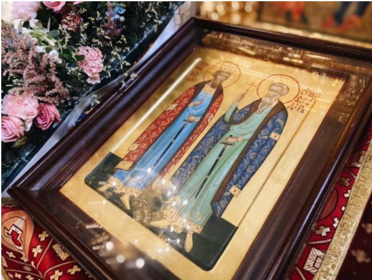
Processed with VSCO with a6 preset