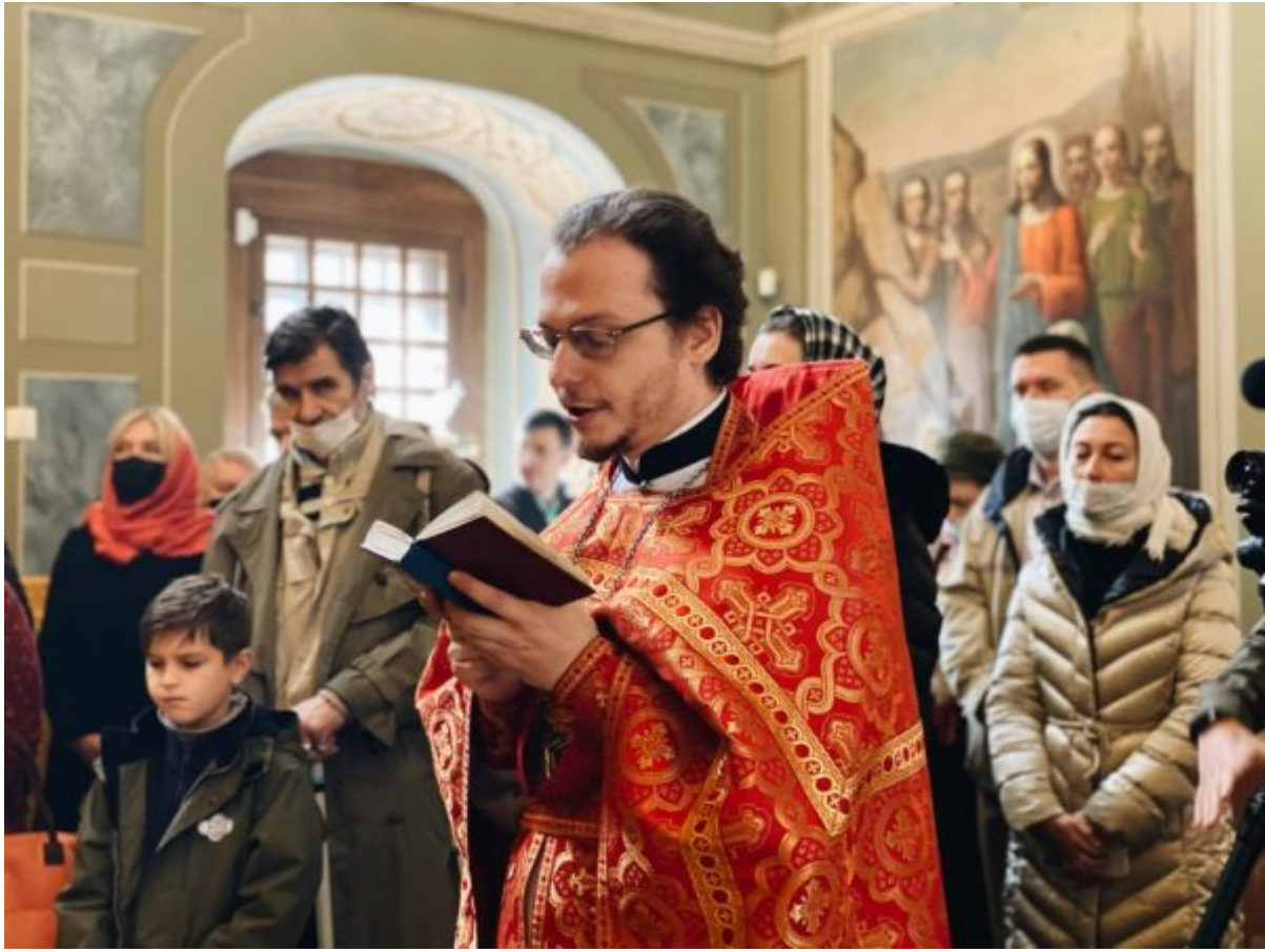
Processed with VSCO with a6 preset