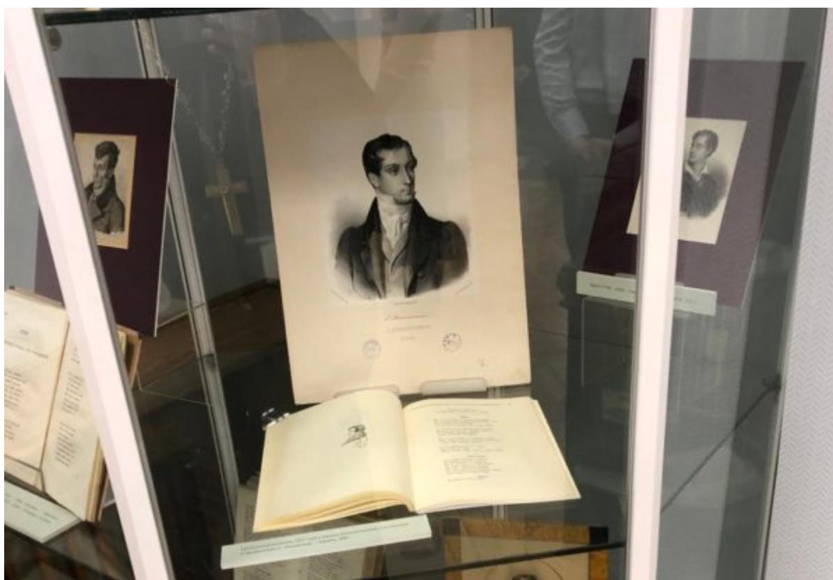
Сборникъ русскаго историческаго общества. Томъ 3. СПб., 1868.

Итакъ, свобода есть право, которое дается государствомъ, и которое должно быть охраняемо закономъ. Свобода есть право, которое дается государствомъ, и которое должно быть охраняемо закономъ. Свобода есть право, которое дается государствомъ, и которое должно быть охраняемо закономъ.