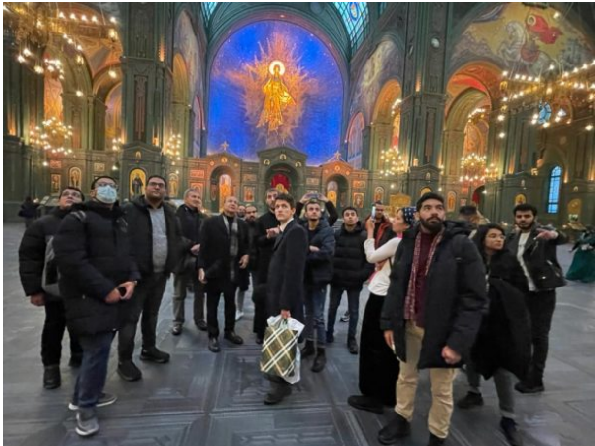
бургских, огским и