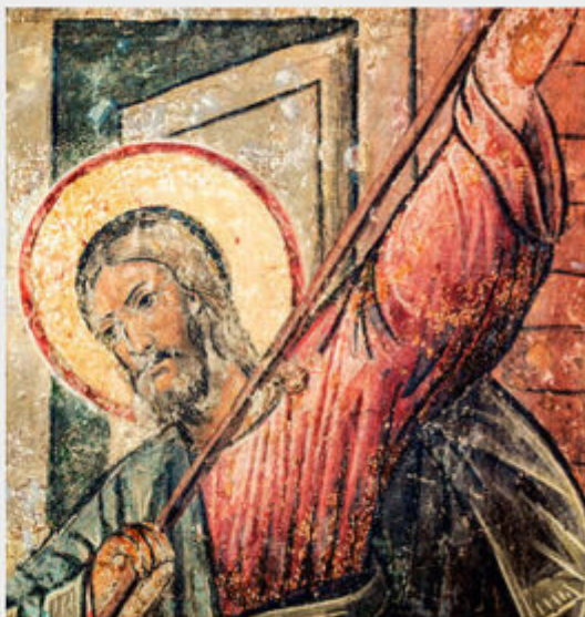
The Savior Detail of the composition, "The Parable of the Good Shepherd"