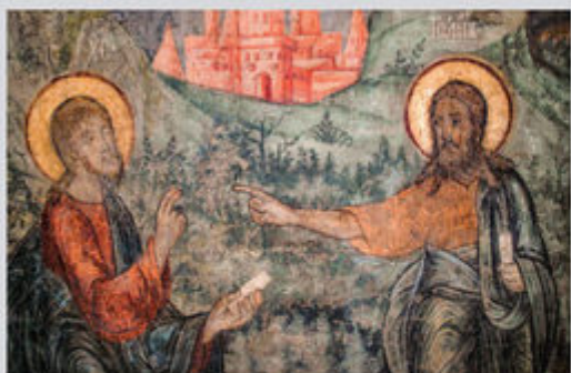
Провозвещатель Иоанн Креститель о Христе Южная стена