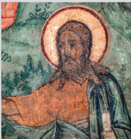
St. John the Baptist Detail of the composition, "St. John the Baptist Preaching About Christ"