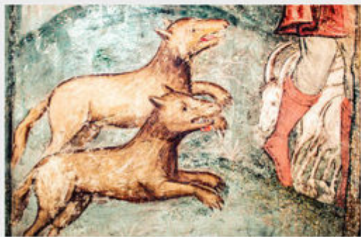
Восан Деталь композиции «Пастух и заблудшие овцы» Северная стена