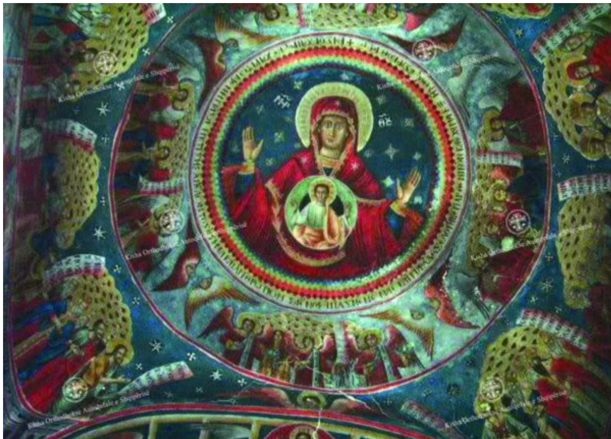
Kisha Orthodhokse Autoqefale e Shqipërisë