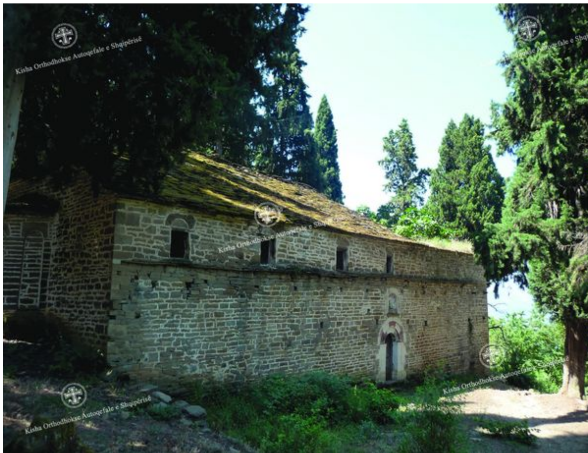
Kisha e Fjetjes së Hyjlindëses, Ogdunan – Përmet