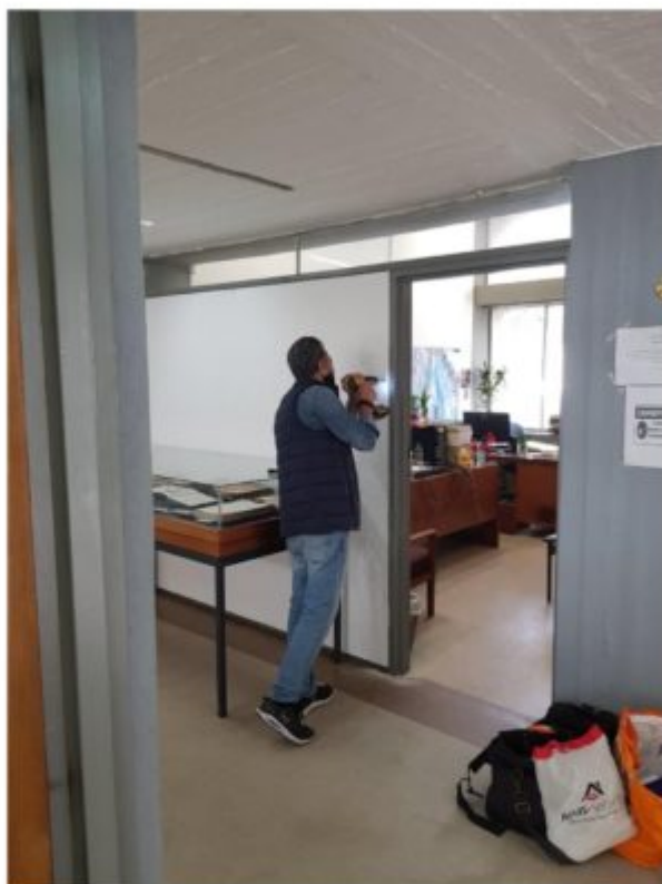
Οι συλλογές της ιστορικής βιβλιοθήκης της Θεολογικής Σχολής πλέον φυλάσσονται με νέο σύστημα συναγερμού.