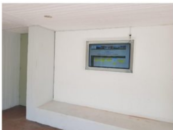
Η οθόνη στο Β' Αμφιθέατρο με το ωρολόγιο πρόγραμμα διδασκαλίας.