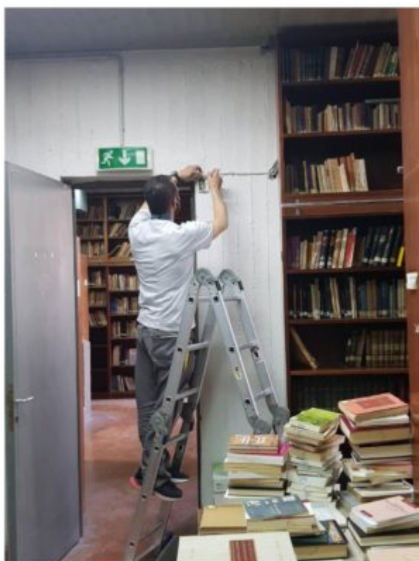
Τοποθέτηση συναγερμού στον υπόγειο χώρο της βιβλιοθήκης.