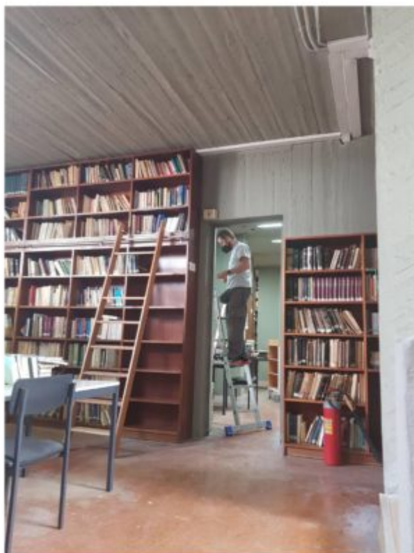
Ταποθέτηση συναγερμού σε όλους τους χώρους της Βιβλιοθήκης της Σχολής.