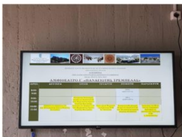
Η οθόνη στο Γ' Αμφιθέατρο με το ωρολόγιο πρόγραμμα διδασκαλίας.