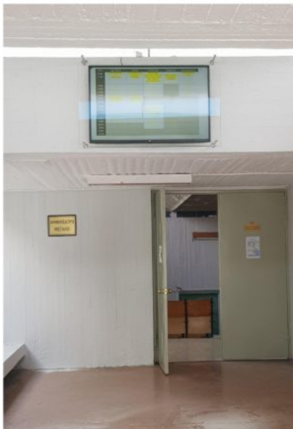
Η οθόνη στο Κεντρικό Αμφιθέατρο με το ωρολόγιο πρόγραμμα διδασκαλίας.