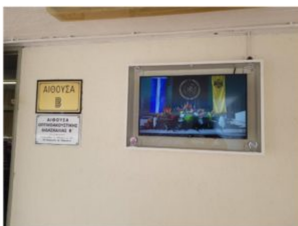
Η οθόνη στη Β' Αίθουσα Οπτικοακουστικής Διδασκαλίας.