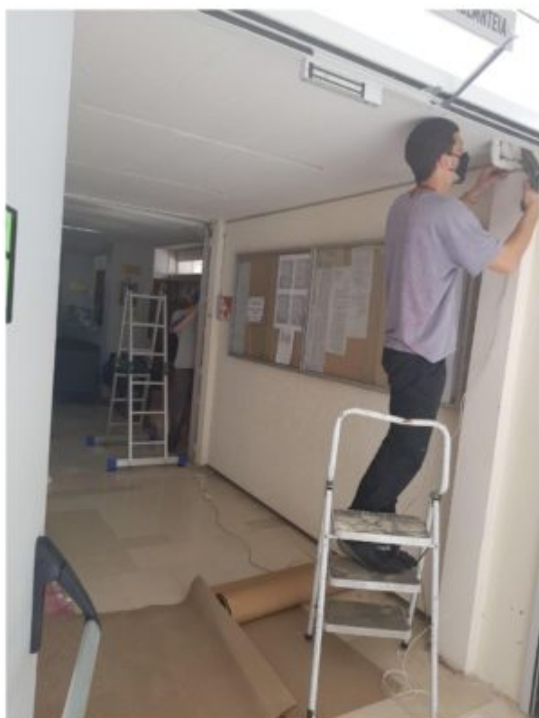
Η Γραμματεία της Σχολής αποκτά νέο σύστημα συναγερμού.