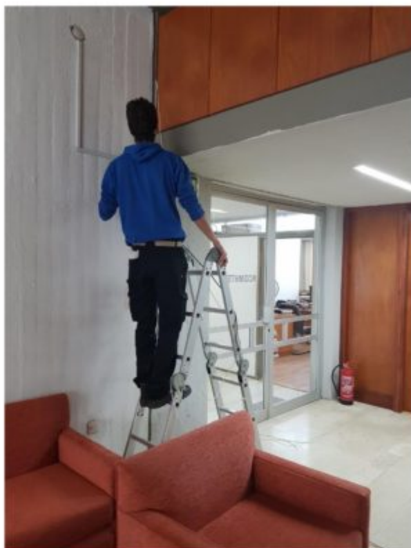
Πέραν της Γραμματείας, ο χώρος υποδοχής, η Κοσμητεία και η Αίθουσα Συνεδριάσεων έχουν καλυφθεί με το νέο σύστημα συναγερμού.