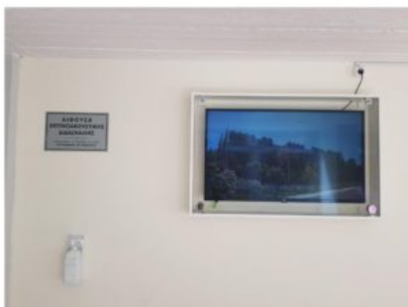
Η οθόνη στην Α' Αίθουσα Οπτικοακουστικής Διδασκαλίας.