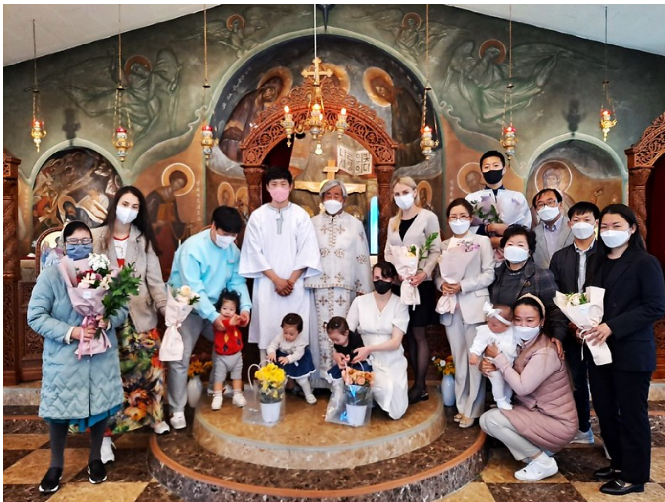
Ευαγγελισμός της Θεοτόκου, Busan