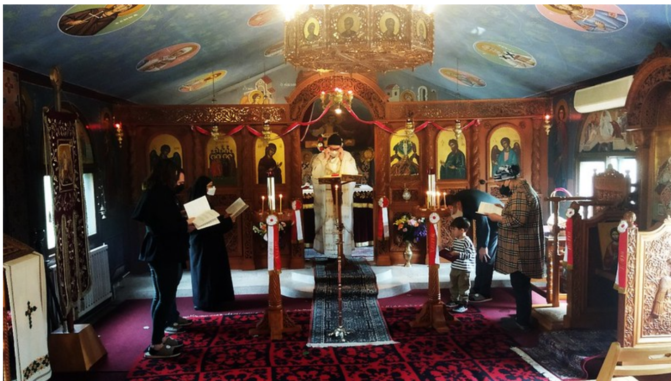
Αποστόλου Παύλου, Incheon