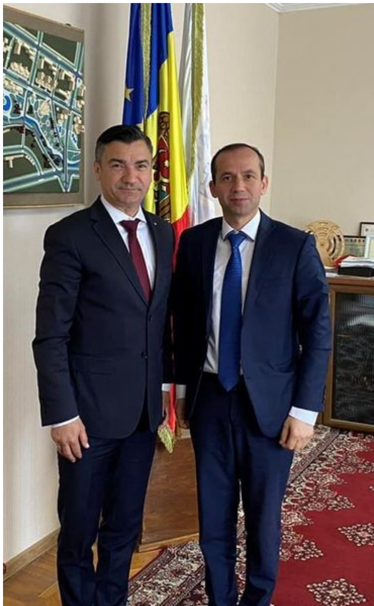
Foto credit: Facebook / Primăria Municipiului Cahul (deschidere articol)