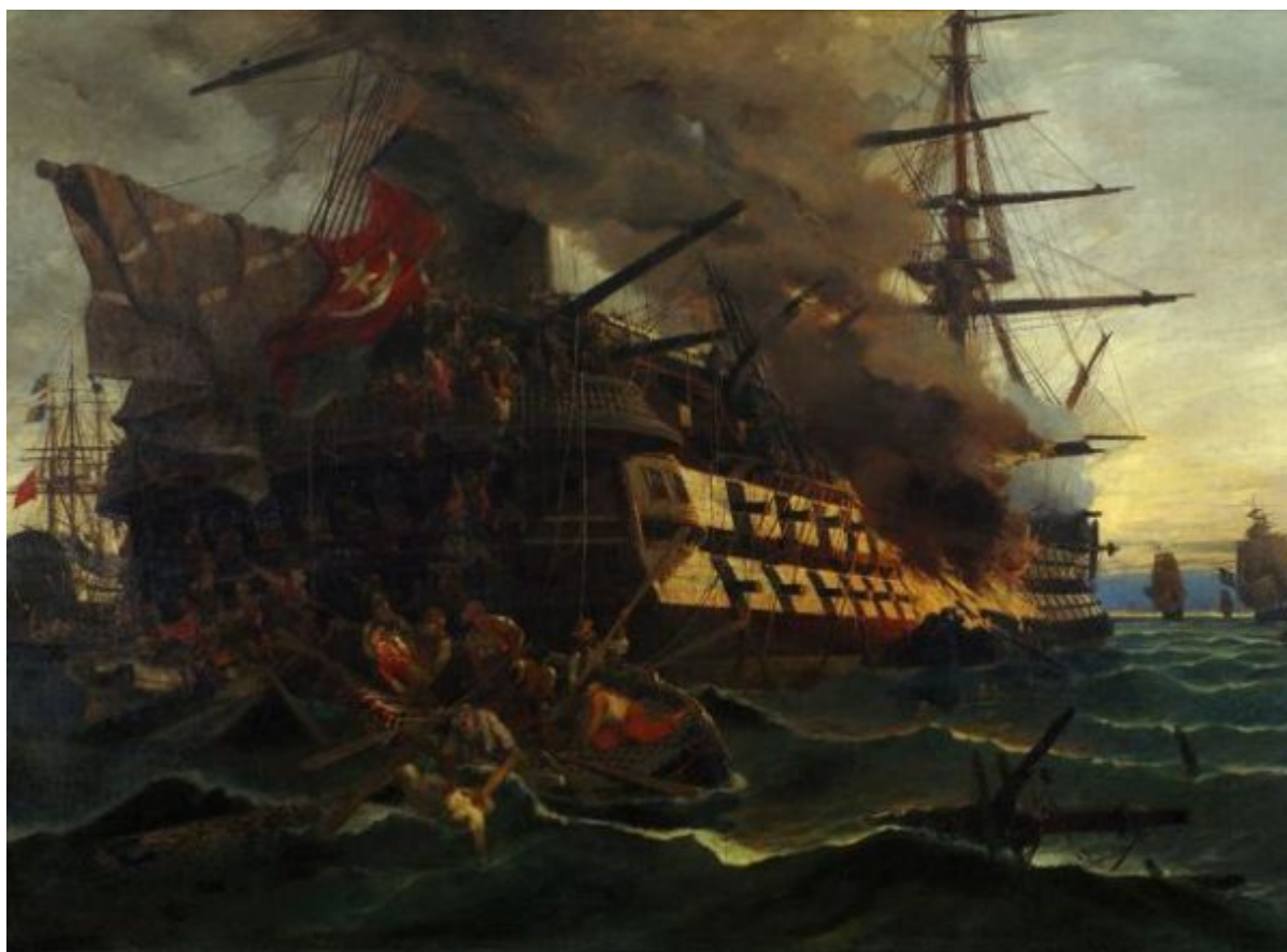
Η πυρπόληση του τουρκικού δικρότου στην Ερεσσό (1882) - Πίνακας του Κωνσταντίνου Βολανάκη (1837-1907)