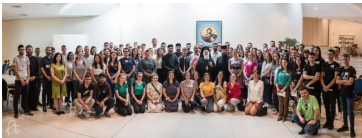
Rinia Ortodokse Tirane