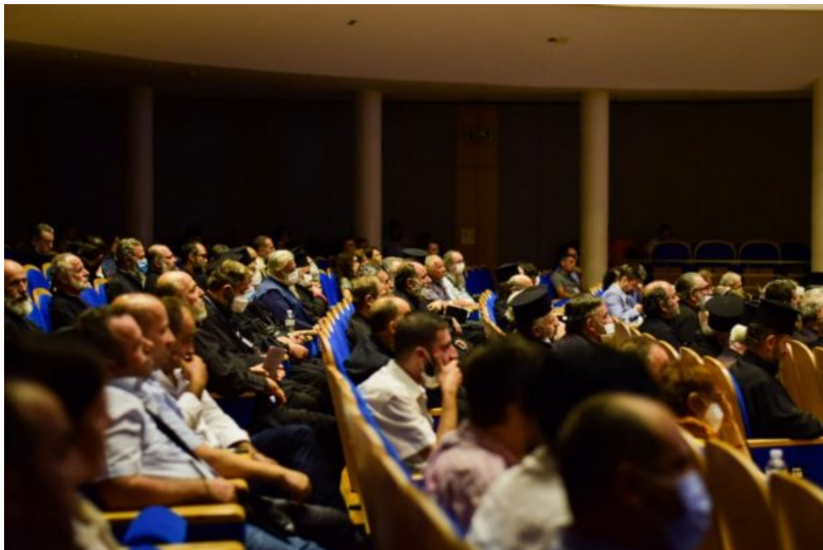
Kisha Orthodhokse Autoqefale e Shqipërisë