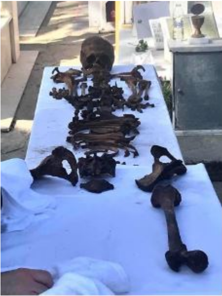
Τα Ιερά λείψανα του Αγίου Καλλινίκου