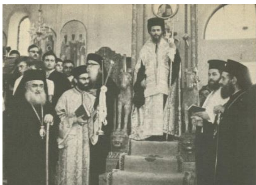
Ο Καλλίνικος στον Επισκοπικό Θρόνο κατά την χειροτονία του, 1967.