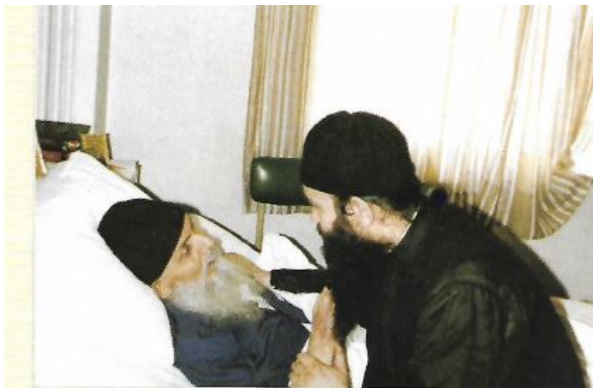
Ο Μητροπολίτης Καλλίνικος στο Νοσοκομείο Κληρικών Ελλάδος, λίγες μέρες πριν την κοίμηση του, με τον τότε Αρχιμανδρίτη και νυν Μητροπολίτη Ναυπάκτου & Αγίου Βλασίου κ. Ιερόθεο, 1984.