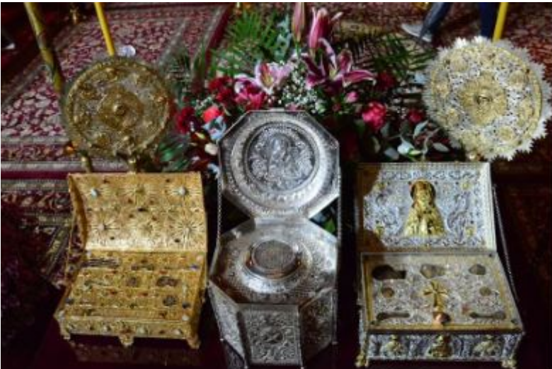
Τα Ιερά λείψανα του Αγίου Καλλινίκου