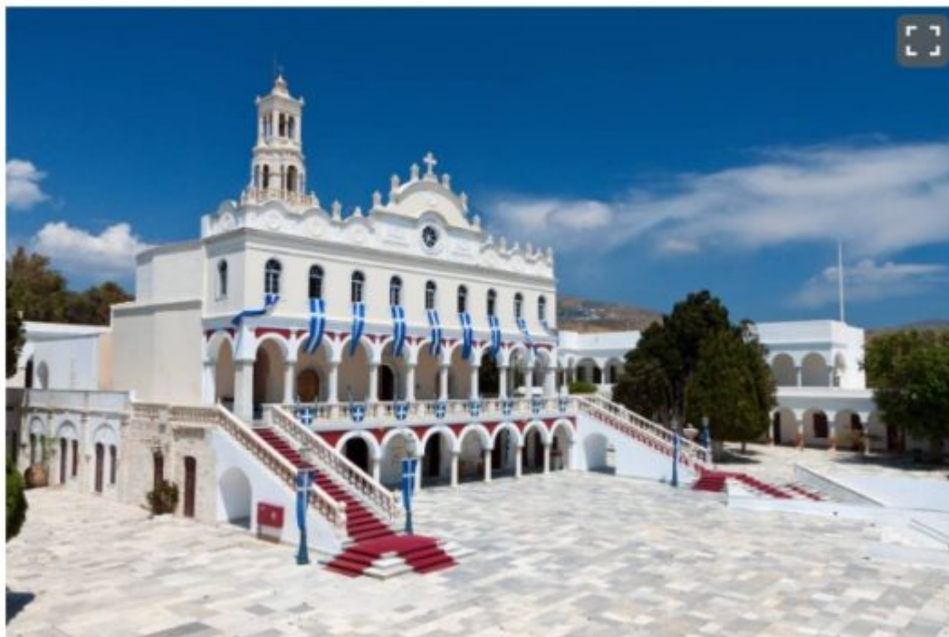
The grand Church of Panagia Evangelistria at Tinos island.

κύρια πόλη του νησιού, τη Χώρα. «Το 1830, αμέσως μετά τον πόλεμο, χτίστηκε πάνω από τα ερείπια μια μεγάλη εκκλησία αναγεννησιακού στυλ. Χιλιάδες Ορθόδοξοι Χριστιανοί συρρέουν εδώ στις μεγάλες Θεομητορικές εορτές», αναφέρεται στο δημοσίευμα και επισημαίνεται ότι την κοσμούν πολύτιμα αφιερώματα των πιστών οι οποίοι την ευγνωμονούν.