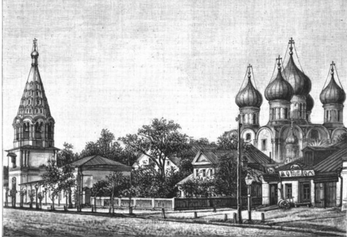
Церковь во имя Рождества Пресв. Богородицы въ слободѣ Бутыркахъ, построенная усердіемъ Бутырскаго полка и освященная патриархомъ Іоанномъ въ 1682 г. По рис. Шарлеманя, грав. Раменскій.