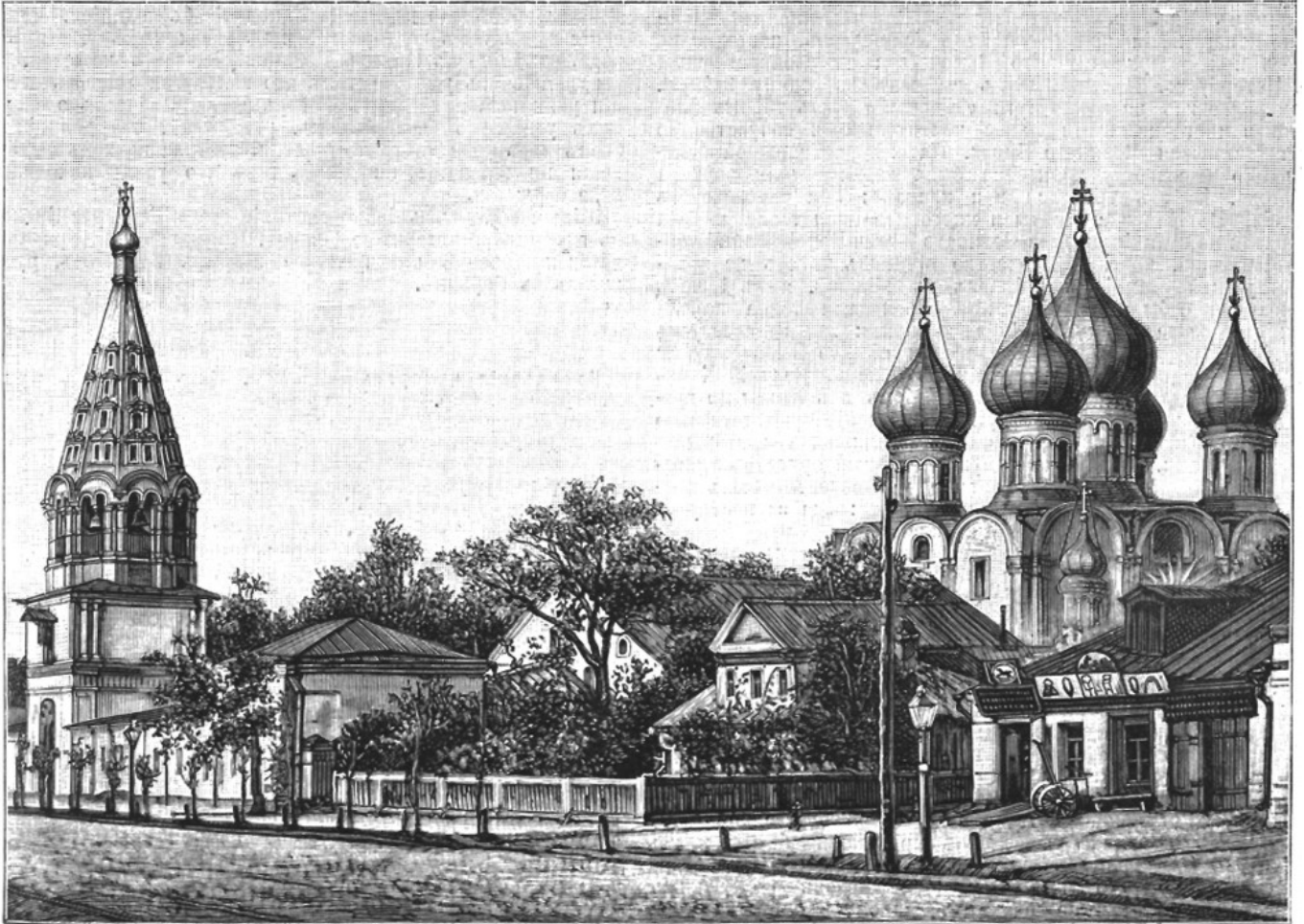
Церковь во имя Рождества Пресв. Богородицы въ слободѣ Бутырнахъ, построенная усердіемъ Бутырскаго полка и освященная патриархомъ Іоаннимомъ въ 1682 г. По рис. Шарлеманя, грав. Рашевскій.

Храм Рождества Пресвятой Богородицы в Бутырской слободе начали реставрировать в 2012 году, сначала в рамках Федеральной целевой программы «Культура России», а уже с 2019 года по государственной программе «Развитие культуры». За это время был усилен фундамент, частично восстановлены фасады.