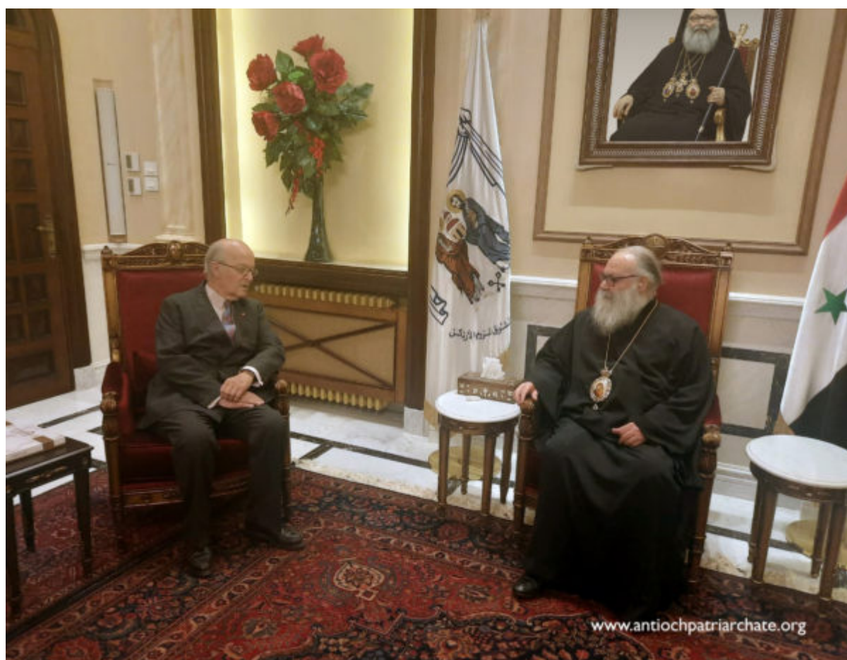
سكذوثرألا مورلل قرشملا رئاسو ةيكاظنا ةيكريرطب Antioch Patriarchate