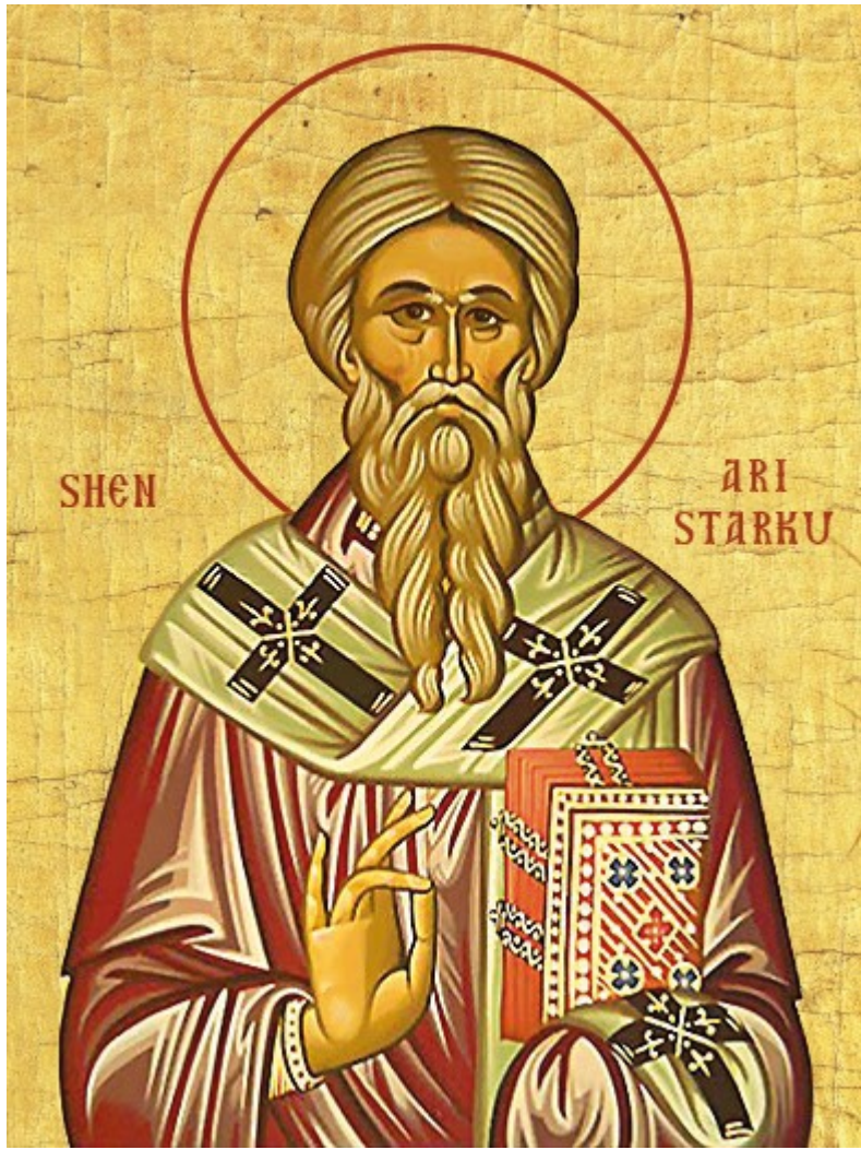
Kisha Orthodhokse Autoqefale e Shqipërisë