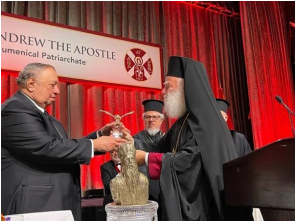
رسم (اطنط) سيلوبومراة ينارطم