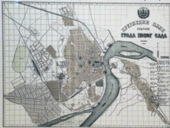
ИСТОРИЧНИ ПЛАН ГРАДА НОВОГ САДА ПОКАЗУЈЕ МЕСТА ГДЕ СУ БИЛИ НЕКИ ОД МАСОВНИХ МЕСТА СТРАДАЊА ТОКОМ НОВОГ САДА И РАЦИЈЕ

Со сѣмъцимъ оутикомъ, Кѣте, дѣшны лѣтъ Твоиго, нѣдѣле нѣтъ болѣзнь, ни печаль, ни воздѣханіе, но жизнь безкѣснаа.