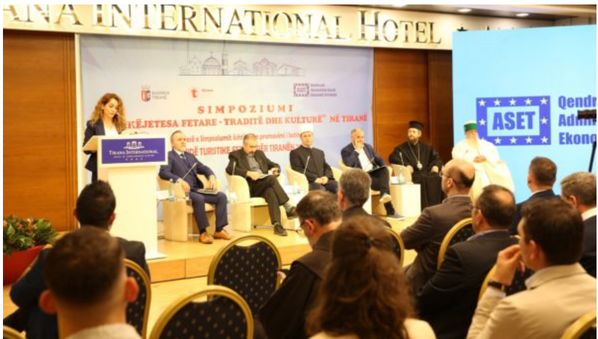
Kisha Orthodhokse Autoqefale e Shqipërisë