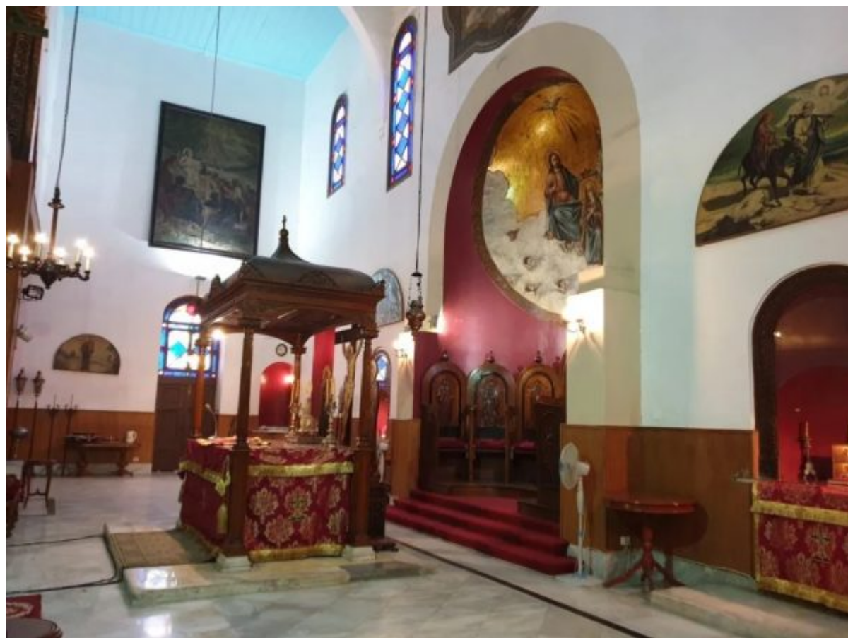
رصم (اطنط) سي لوبومرا ةينارطم