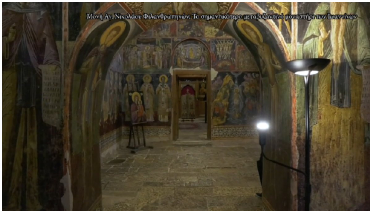
Μονή Αγ. Νικολάου Φιλανθρωπιών. Το σημαντικότερο μεταβυζαντινό μοναστήρι των Ιωαννίνων