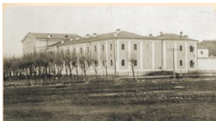
Фото сверху: Городская тюрьма и при ней церковь во имя арх. Михаила и свт. Николая Чудотворца. Кон. XIX — нач. XX в.

Справа — современный вид, Иоанно-Предтеченское архиерейское подворье (ул. Репина, 6Б).