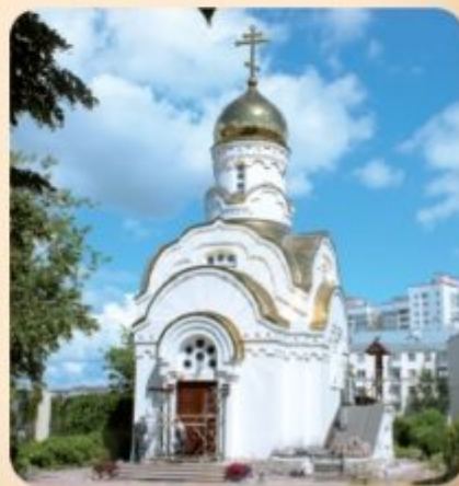
Фото сверху: Городская тюрьма и при ней церковь во имя арх. Михаила и свт. Николая Чудотворца. Кон. XIX — нач. XX в.

Фото снизу слева: современный вид на здание городской тюрьмы, СИЗО № 1, ул. Репина 4.