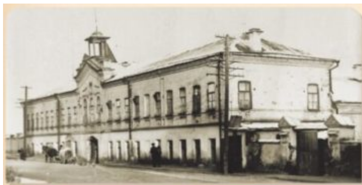
Фото сверху: Церковь во имя свт. Николая Чудотворца при городской богадельне. 1930-е гг.