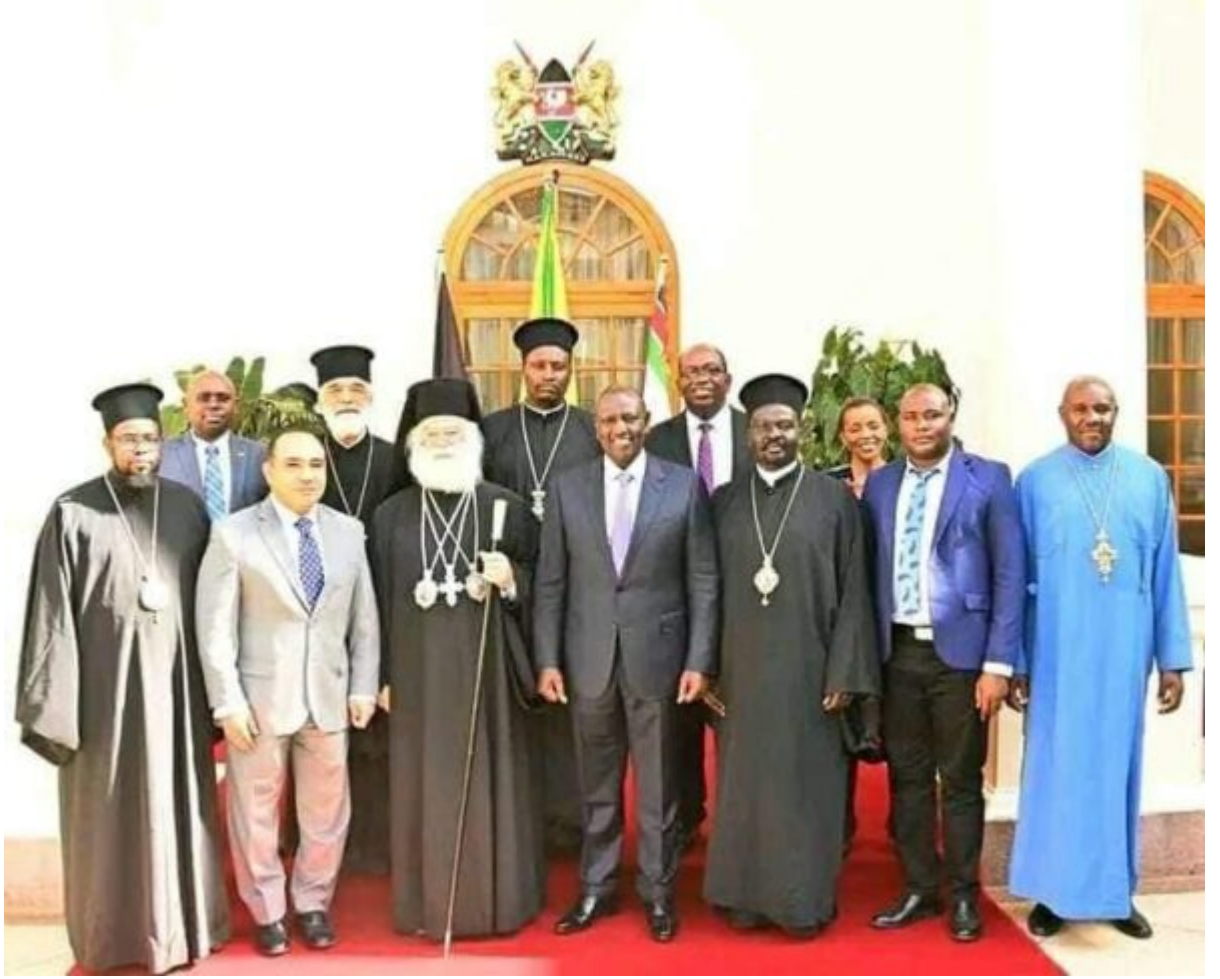
رسم (اطنط) سىلوبومراة ن ارطم