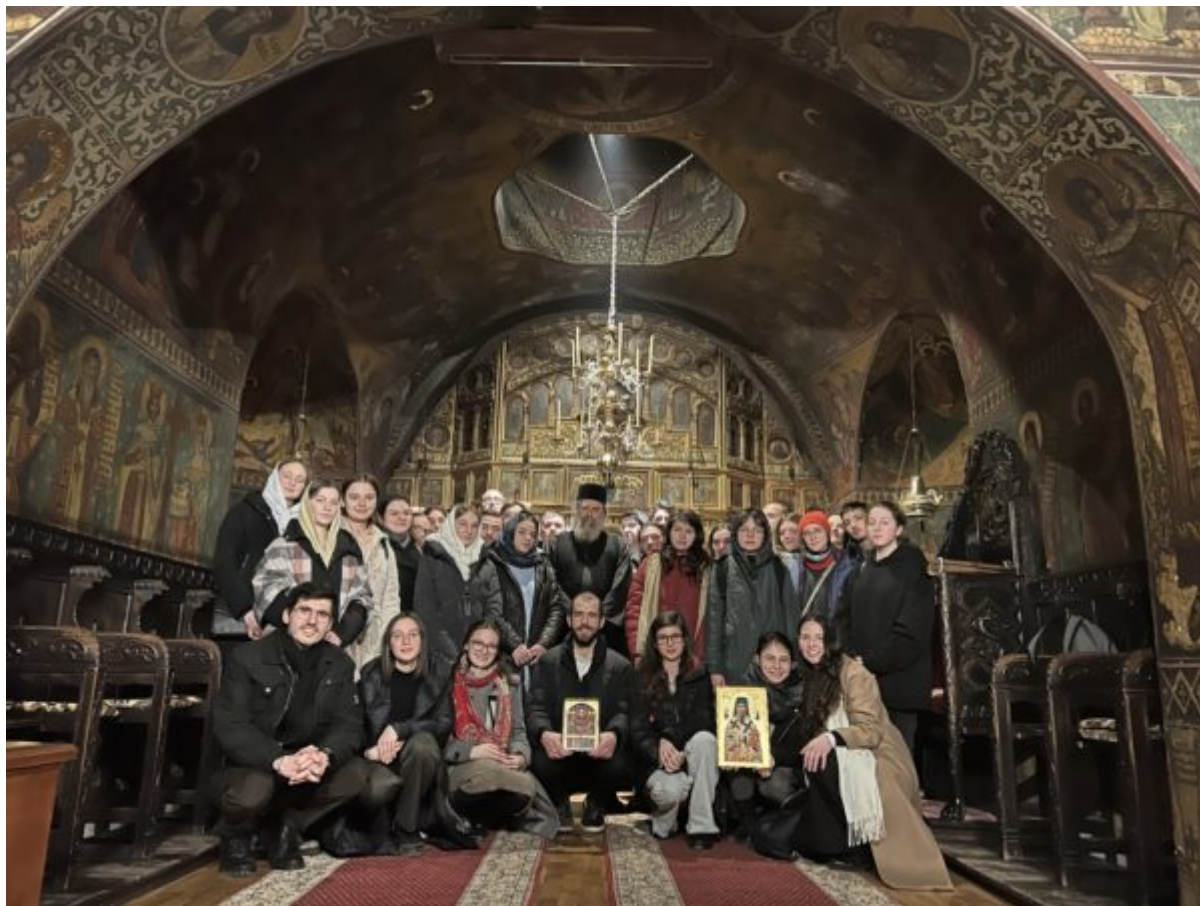
enumit „O ul popular