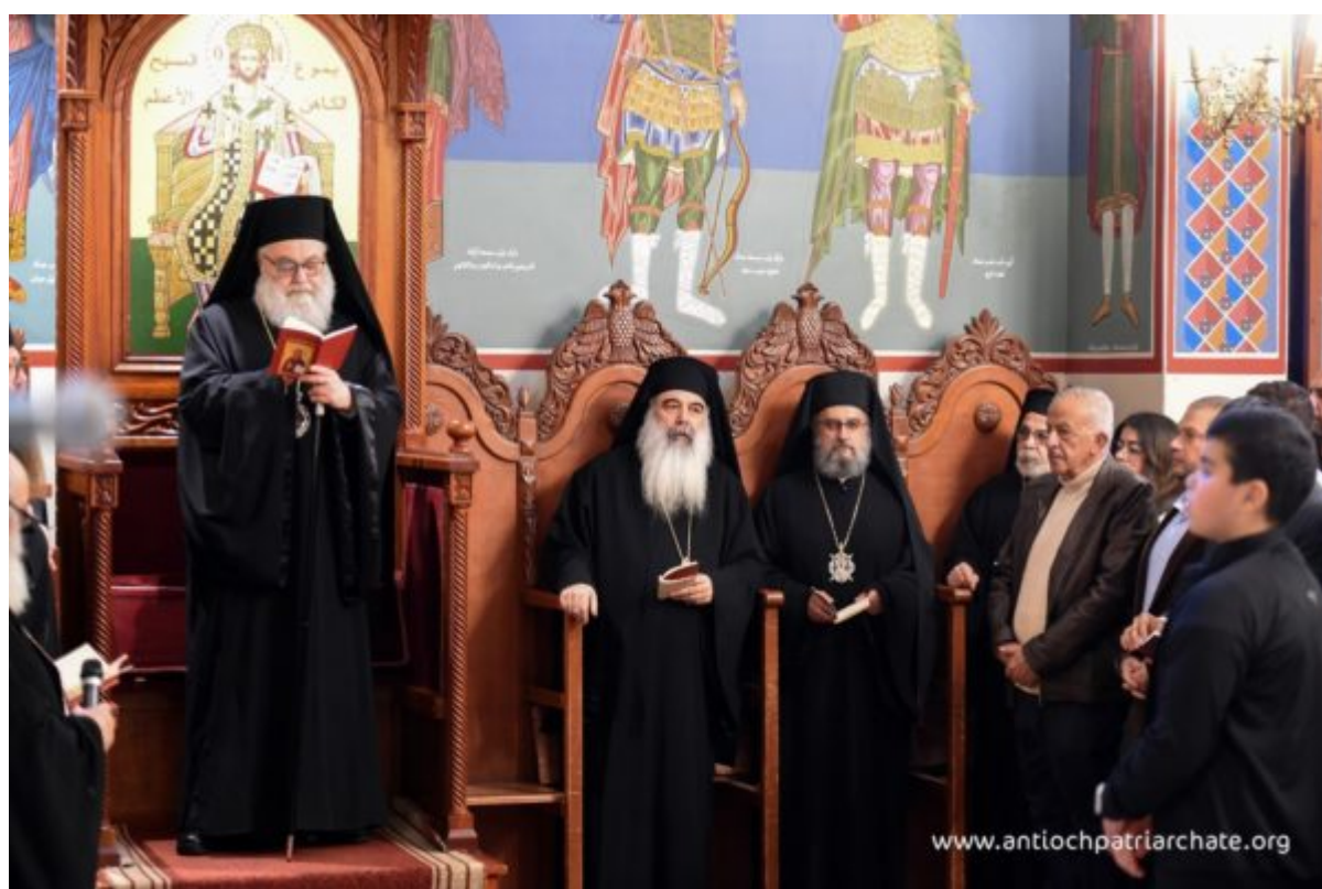
سكذوثرألا مورلل قرشملا رئاسو ةىكاظنا ةىكرىرطب Antioch Patriarchate