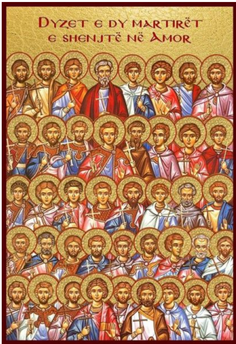
Kisha Orthodhokse Autoqefale e Shqipërisë