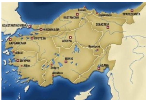
Ιστορικός χάρτης της Μ. Ασίας