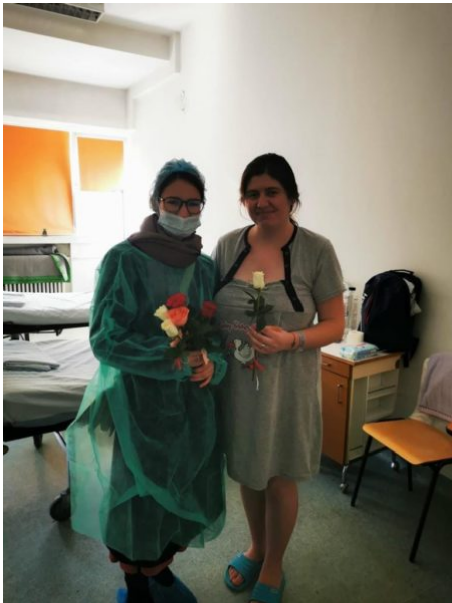
Foto credit: Facebook / Tinerii Protopopiatului Sector 4 Capitală (deschidere articol)