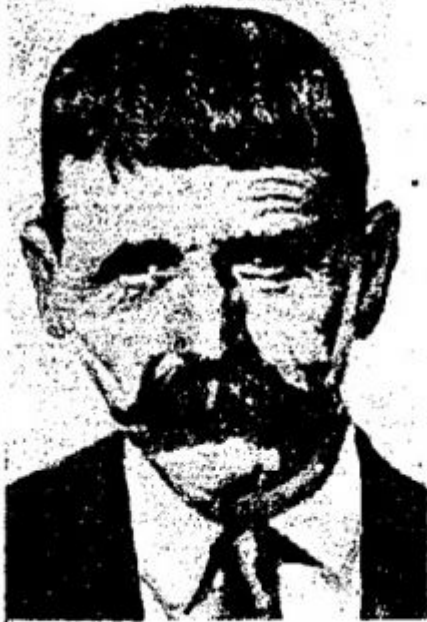
Ο Λούης σήμερα

Με τόν έορτασμόν τής 40ετηρίδος από τής αναβιώσεως τών ολυμπιακών αγώνων, ξυπνά εις τήν ψυχήν όλων τών Έλλήνων ή ύπερηφανεία, που ένοιωσεν όλη ή Έλλάς, πρό 48 έτών, όταν έγιναν οι πρώτοι διεθνείς ολυμπιακοί αγώνες και ήλθε νικητής του Μαραθωνείου δρόμου ένας Έλλην άθλητής, ο Σπύρος Λούης. Οι παλαιότεροι ένθουμούνται τήν φρενίτιδα του ένθουσιασμού, που κατέλαβεν όλον τόν ελληνικόν κόσμον, ο οποίος κατέκλυζε τάς κερκίδας του Σταδίου, όταν είσηλθεν ο πρώτος μαραθωνοδρόμος εις τόν στίβον ένω εις τόν Ιστών τής σημαίας έκυμάτιζαν τά ελληνικά χρώματα. Τί ήταν ο άθλητής εκείνος που έδόξασε τό έλληνικόν όνομα, όλοι τό ξέρουμε. "Ένας απλοϊκός εργάτης, που κουβαλούσε τότε μάρμαρα ά-