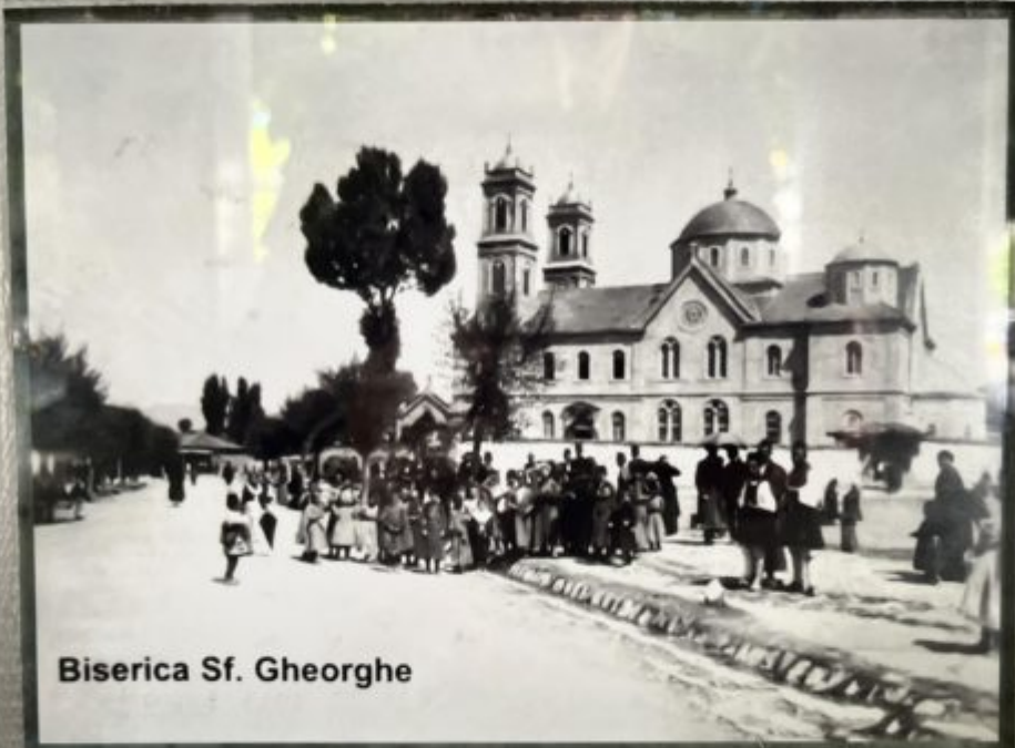
Biserica Sf. Gheorghe