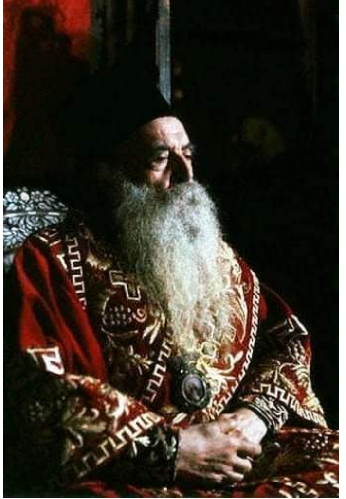
ەبەرەللا غەللەب ەن نوکس مالا ەکریرطبالا