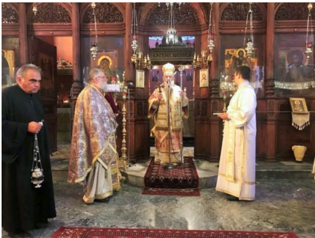
(Επιμέλεια-φωτογραφίες: Γεώργιος Ι. Χρυσούλης, γραμματεὺς Ἱεράς Μητροπόλεως,