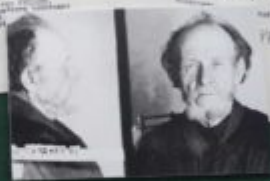
Исходные данные Исследования Исследования Исследования

Исследования Исследования Исследования Исследования