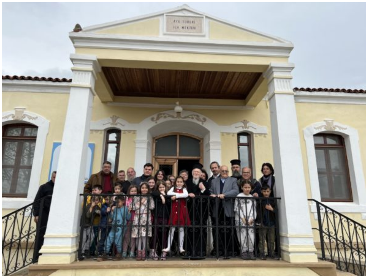
(Ο Οικουμενικός Πατριάρχης κ.κ. Βαρθολομαίος με τους μαθητές και δασκάλους του σχολείου του χωριού του των Αγίων Θεοδώρων στο οποίο μαθήτευσε κι ο ίδιος)

πρωτοβουλία της Α.Θ.Π. του Οικουμενικού Πατριάρχη κ.κ. Βαρθολομαίου και στη χορήγηση της άδειας από την κυβέρνηση Ερντογάν για άνοιγμα και πάλι των ελληνικών σχολείων στο νησί, όπως επίσης και στη στήριξη του ελληνικού κράτους.