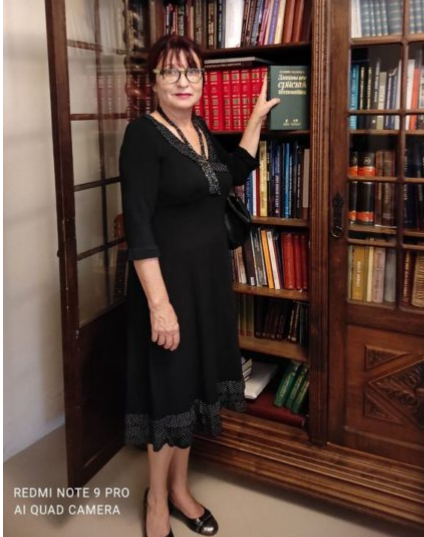
REDMI NOTE 9 PRO AI QUAD CAMERA